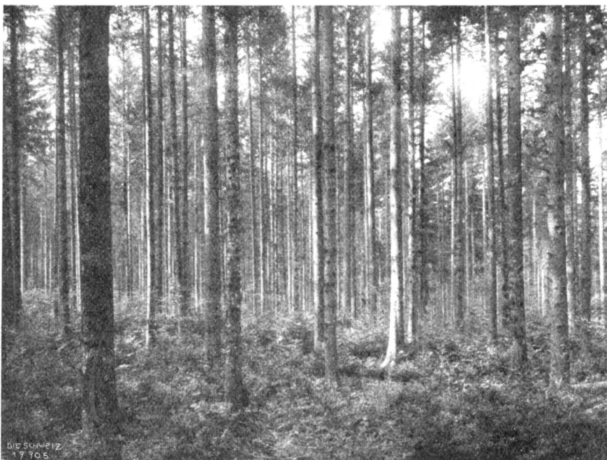
Stadtwaldungen Biel. Hundertjähriger, allmählich gelichteter Fichtenbestand mit natürlicher Verjüngung von Fichten und Weisstannen.

Fast andächtig blickte ich nach dem verheißenen Lande hinüber. Da lag es hoch ob uns, das alte, stattliche Patrizier-