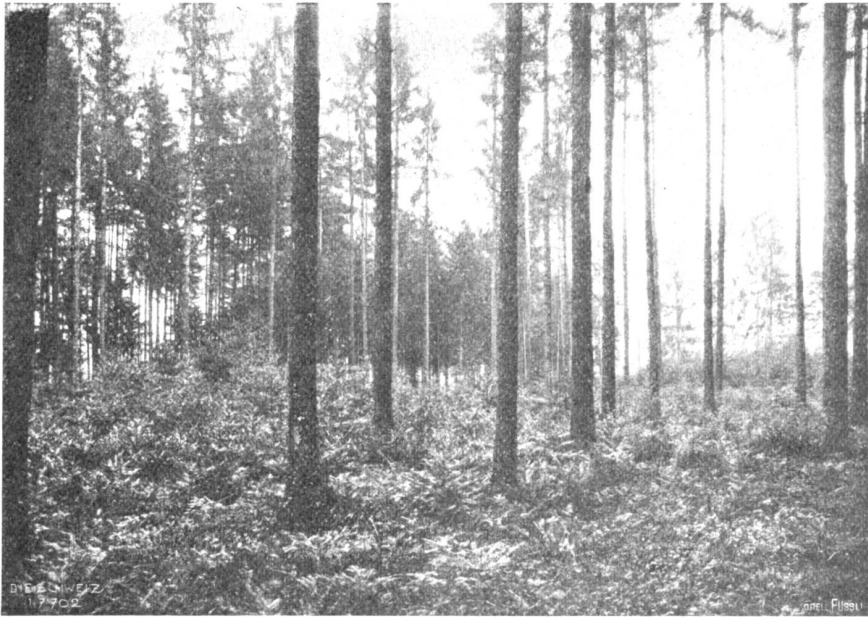
Stadtwaldungen Winterthur. Ein modernes Bestandesbild. Durch allmähliche Lichtung in zehn Jahren erzielte natürliche Verjüngung in einem 75-jährigen Fichtenbestand; der Zuwachs am Oberhand bleibt erhalten, ja steigert sich sogar und konzentriert sich auf die schönsten Bäume.

scheußlicher Weise entstellen. Auch bei sofortiger sorgfältiger Wiederaufforstung bleibt ein unerfreuliches Bild jahrelang bestehen . . .“