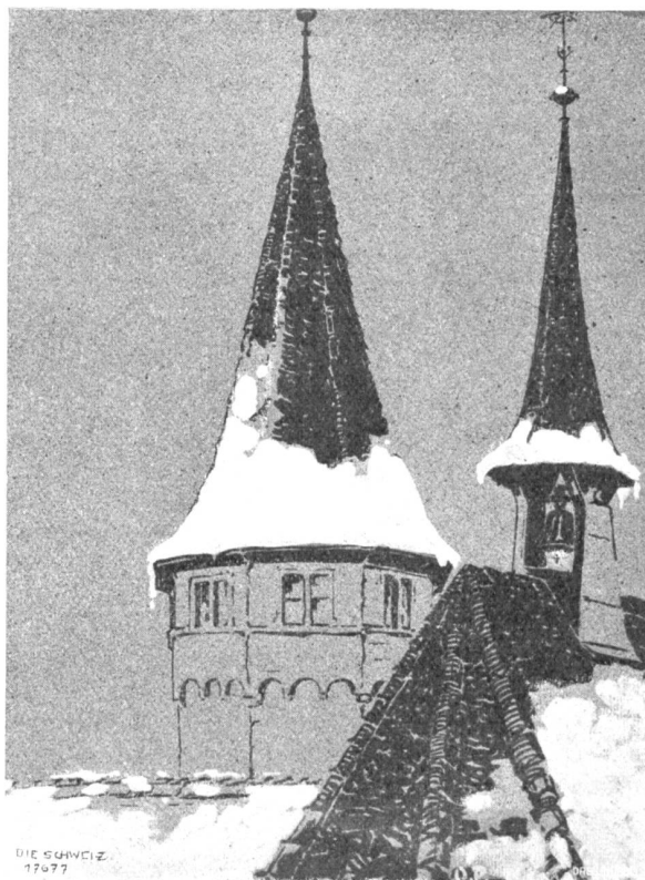
Zur Kultur des Auges Abb. 1. Schneeschmelze (Motiv aus dem Schweiz. Landesmuseum). Skizzenarbeit eines Schülers der III. Seminarklasse.