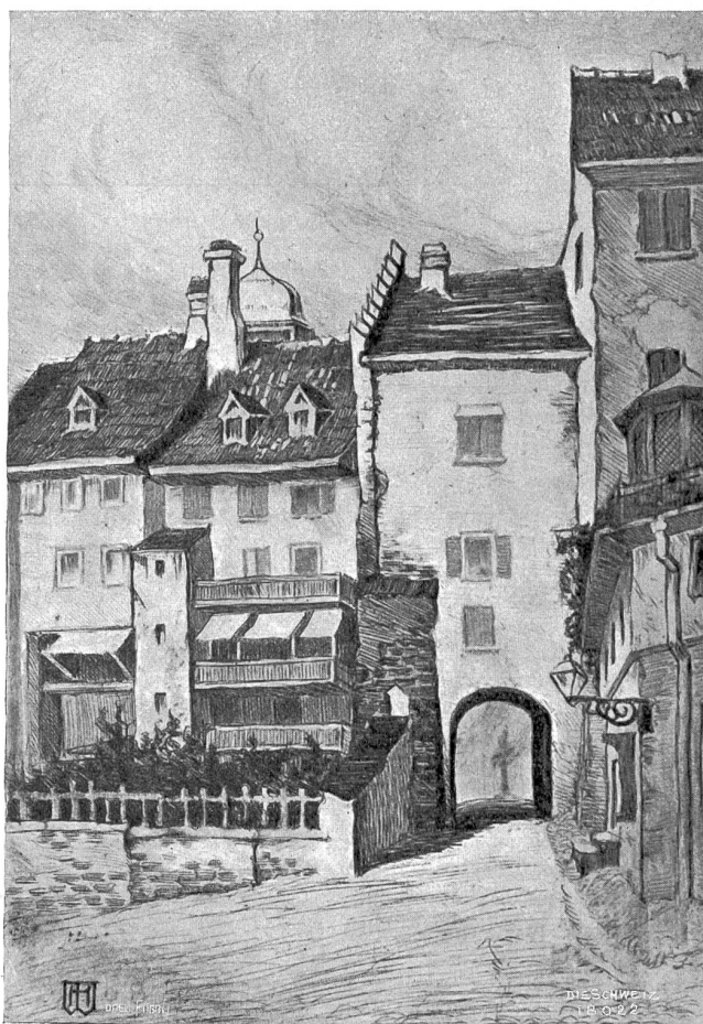
Oberes Tor in Wil. Nach der Radierung von Heinrich Waldmüller, München.

Hochaufgerichtet stand die Marchesa, las wieder und wieder, in Gedanken versunken. Plötzlich, instinktiv — war