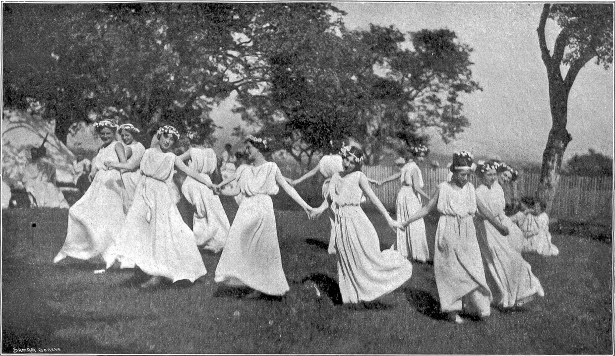
Orpheus-Aufführungen zu Mézières. Tanz der „Glücklichen Schatten“, für die photographische Aufnahme von S. A. Schnegg & Co., Lausanne, im Freien wiederholt.