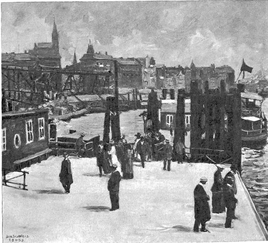
Frig Obwald, Zürich-München.