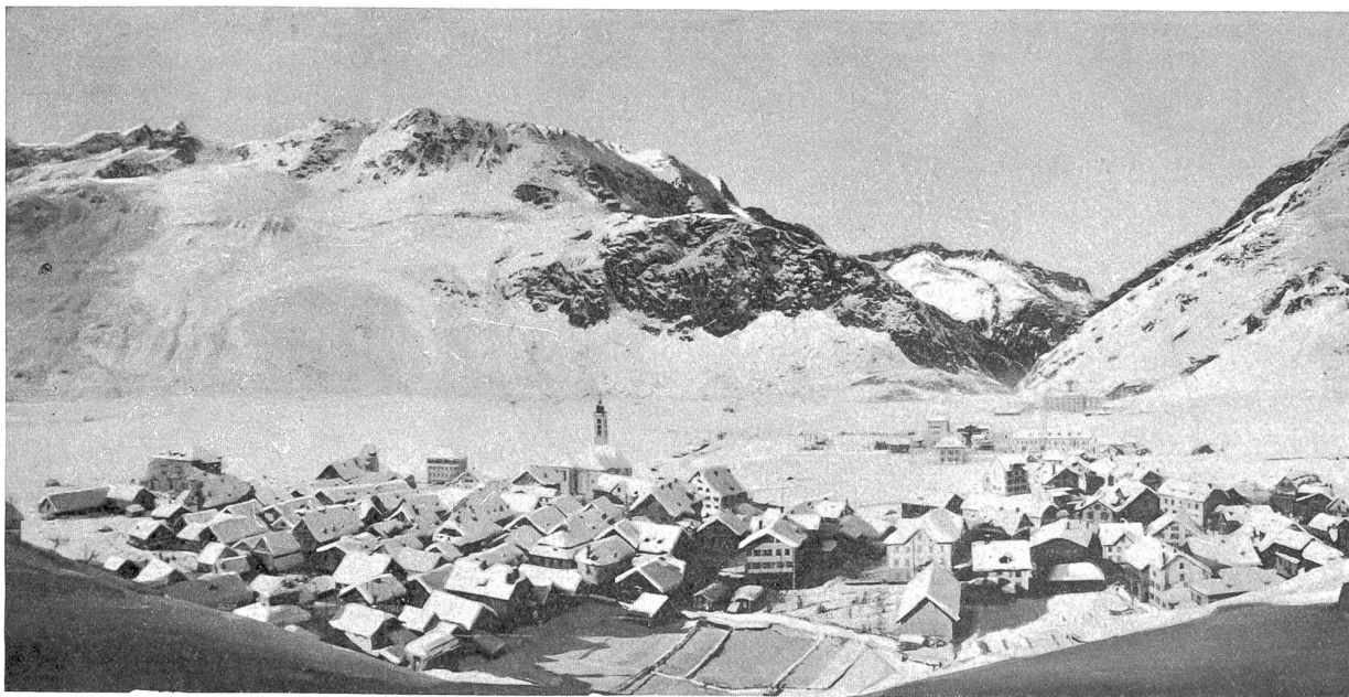
Andermatt im Winter.

gadiner Sonne gebildeter Harsch und Pulverschnee wechselten an den steilen Hängen jeden Augenblick, sodaß mehr von mühsamem Stodreiten und Bodenliegen die Rede war als von regelrechtem elegantem Skilauf. Erst bei dem Wald ob Madulein wurde der Schnee wieder gut; da erwiesen sich in dessen wieder die Dichte des Baumbestandes und die Steilheit