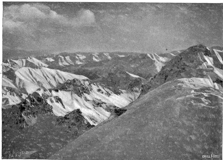
Kelschgipfel (rechts) und Fuorela d'Eschla (Mitte, unten) am 24. Dez. 1906.

Als wir morgens 6½ Uhr, also noch in voller Nacht, unter Laternenschein den Weitermarsch antraten, mochte draußen eine Kälte herrschen, welche die 30° erheblich überschritt und wohl nahe an 40° herantam. Dem entsprechend waren wir auch völlig vermummt: Wollhemd und Lismer unter dem zugeknöpften schweren Bergrock, Skimütze über den Kopf heruntergezogen, dicke Wollstrümpfe und Ziegenhaarsocken in den weiten wasserdichten Laupartschuhen, zwei Paar wollene Fäustlinge an den Händen. Dergestalt lief man sich bergauf in eine behagliche Temperatur hinein, und doch hätte bei Wind oder man-