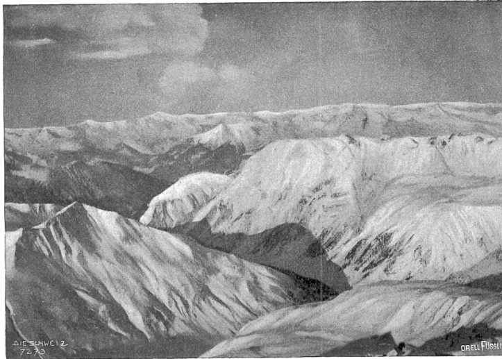
Winterpanorama vom Piz Kelsch, gegen Val Tuors, Ducan-Kette und Aroser-Berge.

gelmder Marschlichkeit die Besteigung wegen der Gefahr des Erfrierens nicht gewagt werden dürfen.