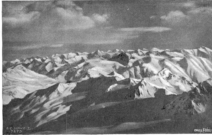
Silvrettagruppe im Winter, vom Piz Kelsch.

Badret d'Eschia, der eine ideale Abfahrt bot. So ward schnell die Zuozzer- oder Rascher-Hütte auf dem Muot ot (dem „Hoch-Bud“) erreicht. Da mußten wir nun vor allem unsere Bekleidung etwas erleichtern; denn jetzt, nachmittags zwei Uhr, war es an der Sonne brennend heiß geworden. Auch denkt man, je näher den Wohnstätten, desto mehr wieder an gewohnheitsgemäße Speise und Trank. Die weitere Talfahrt gestaltete sich zu unserem großen Bedauern