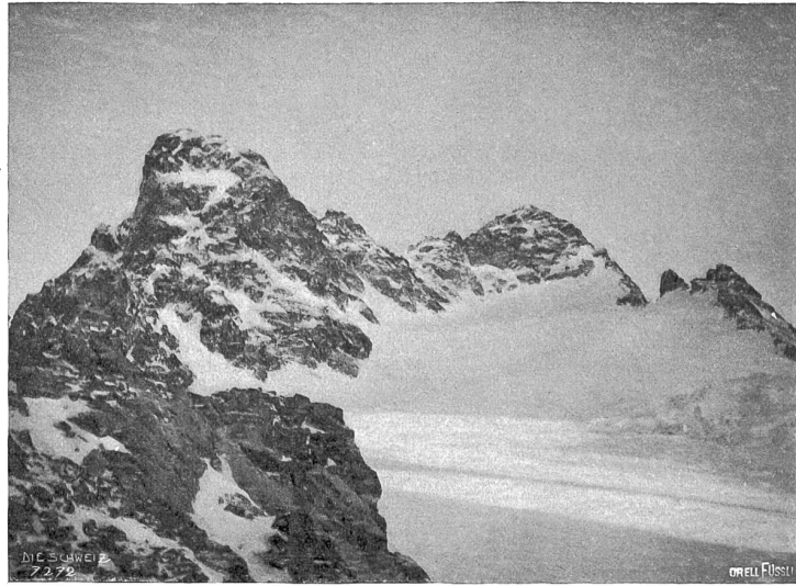
Piz Kelsch 3420 m (rechts) mit der Nadel 3388 m (links) und dem Porchabella-Gletscher, von der Fuorela d'Eschla 3008 m.

den mit zwei Tännchen, von denen eines den Weihnachtsbaum bei Tisch markieren, das andere den Kelschgipfel schmücken sollte. Glühwein, Kuchen und Zigarren legten wir als unsere Gaben hin neben die beim Glatern einiger Kerzlein wohlduftenden Reiser. Durch das Kochen des einfachen Abendmahls, das in festlicher Stimmung verzehrt wurde, vermochten wir den engen Borraum auf die behagliche Wärme von 0° (!) zu bringen, eine Temperatur, die freilich bei gelegentlichem Öffnen der Türe rasch wieder tiefer sank, sodaß wir uns schleunigst in die sämtlichen vorhandenen Wolldecken einhüllten und zum Schlaf anschlückten.