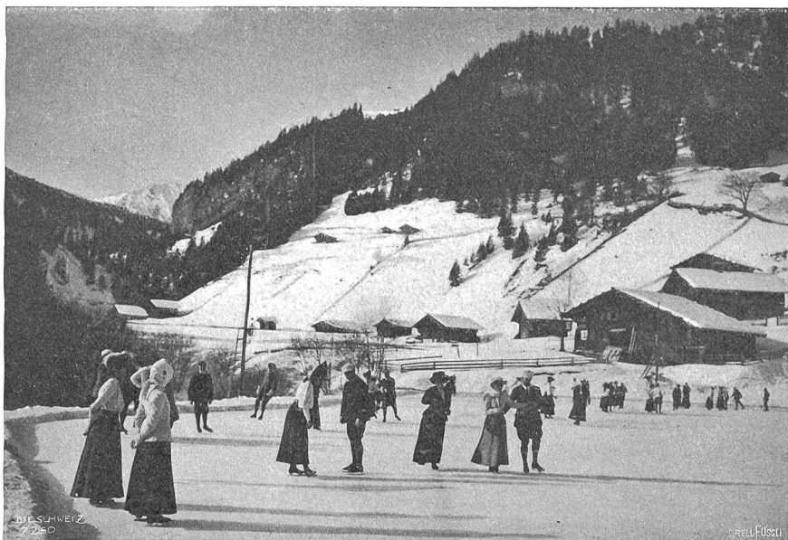
Eisbahn in Adelboden.

Die Sonne hat hier überall ungehinderten Zutritt und überflutet Tal und Berg mit ihren wärmenden Strahlen, den Spitzen jene Lichter aufsetzend, die sie diamantgleich in der trockenen, reinen Winterluft glitzern lassen. Die Sporttreibenden sind neben den Erholungsuchenden in großer Mehrzahl unter den Besuchern Adelbodens und stempeln so den Ort in erster Linie zum Wintersportplatz. Insbesondere ist es der Skisport, der hier ein äußerst günstiges Feld findet. Das Dorf selbst steht inmitten eines „Skifeldes“, eines Übungsplatzes, und die übrige Talschaft mit den leicht erreichbaren Pässen, Höhenzügen und Gipfeln bietet dem Skifahrer die reichste Auswahl an leichten und schwierigen Touren. Adelboden pflegt seine sportlichen Einrichtungen mit peinlichster Sorgfalt; seine Eisplätze sind wie die Schlittelbahnen Musteranlagen. Kein Wunder! Denn der Einheimische selbst geht in seinen freien Stunden dem Sport nach, und fast möchte man glauben, daß die Jugend erst das Skilaufen und dann das