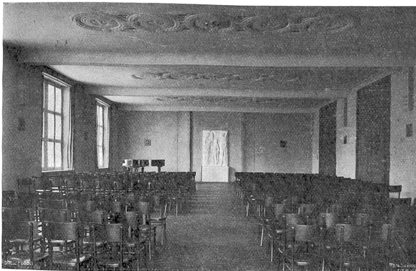
Streiff & Schindler, Zürich.

In dieser Weise spulte Hänsling einen Tag wie den andern herunter und befand sich gar wohl dabei.