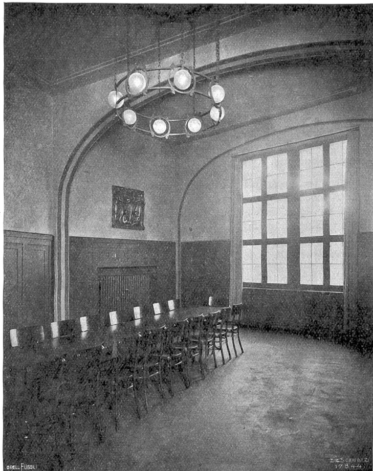
Streiff & Schindler, Zürich.

Fast das ganze Erdgeschoß ist durch die alkoholfreie Wirt-