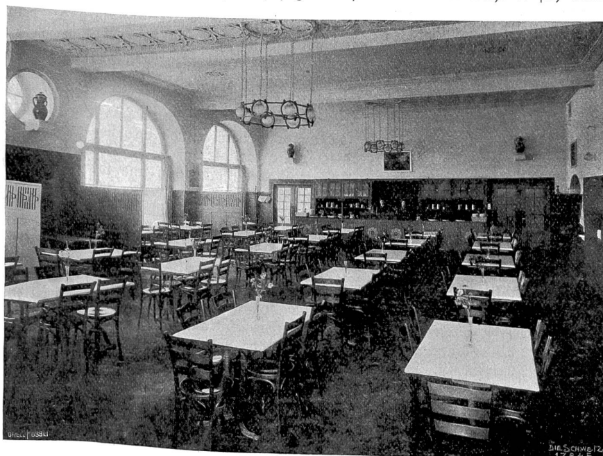
Streiff & Schindler, Zürich.

Der sich nun eines solchen vorbildlichen Wandels bemühte und sich im Städtchen Dasein und Fortkommen sicherte, war ein ehrfamer Porzellanmaler, zugewandert aus schlesischen oder aus brandenburgischen Landen, welchen Zweifel er standhaft aufrecht hielt, indem er auf Befragen stets einen Geburtsort angab, den keine Landkarte im Städtchen zeigte, und sich bald als