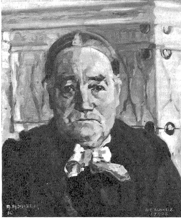
Alfred Marxer, Zürich-München. Bildnis von Frau Sch. (1910).