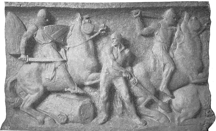
Schweiz. Nationaldenkmal in Schwyz. Mittelstück des Relieffrieses von Eduard Zimmermann, Stans-München.

den Rücken laufen beim Lesen der Rezepte zu den beliebtesten mittelalterlichen Latwergen und Pillulen. Eines der Hauptmedikamente, der alles heilende Theriak, zur Zeit des Königs Mithridates von Pontus erfunden, war ursprünglich nicht übermäßig kompliziert, Damokrates jedoch, einer von Neros Leibärzten, änderte das Rezept ab, und diese sogenannte verbesserte Vorschrift, die 55 Bestandteile enthält, ging in alle ältern Rezeptbücher über. Einer der Hauptbestandteile ist Schlangenfleisch, und die Schlange (Thrus) gab der verbesserten Latwerge den Namen Theriak oder Theriak, unter dem sie ein langes unheilvolles Leben geführt hat; selbst in der 1882 außer Gebrauch gekommenen