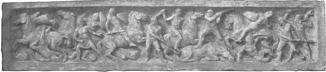
Schweizerisches Nationaldenkmal in Schwyz. Relieffries von Eduard Zimmermann, Stans-München.

und nahm sich einen Schwyzerburschen von Ingenbohl, einen Nachkommen der Sieger von Morgarten und Sempach, zum Modell und erschuf seinen mit der Streitart bewaffneten Schwyzer, dem der nationale Stolz und die mehrkräftige Entschlossenheit um die Augenbrauen und die Hafennase geistert, nach dem lebendigen Leben.