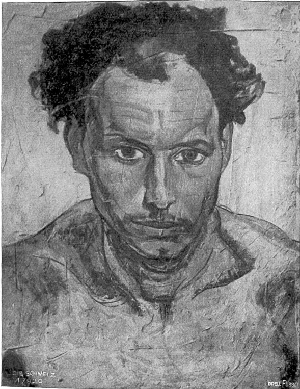
Eine Schweizerische Kunstschule in Florenz.

*) Original im Schweiz. Landesmuseum. **) Verbauung.