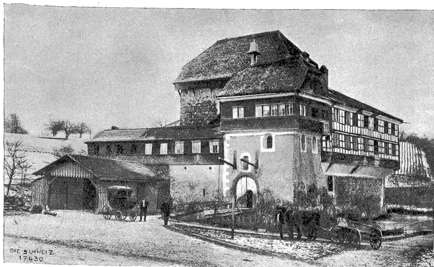
Schloß Hagenwil, Kt. Thurgau.

Ich bin berufen allenthalbn/ Kan machen viel heilsame Salben/