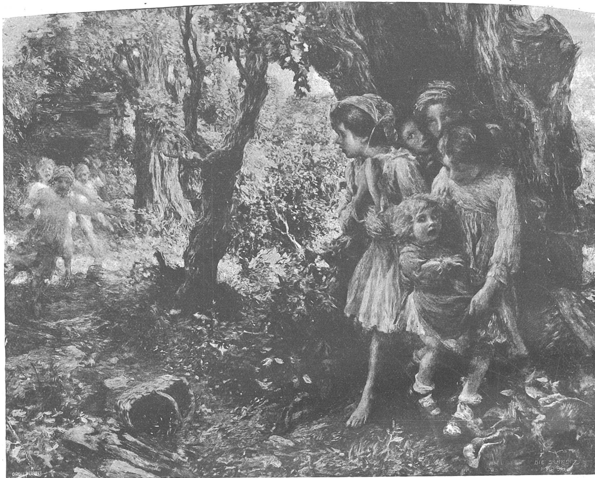
Pietro Chiela, Sagno-Mailand.