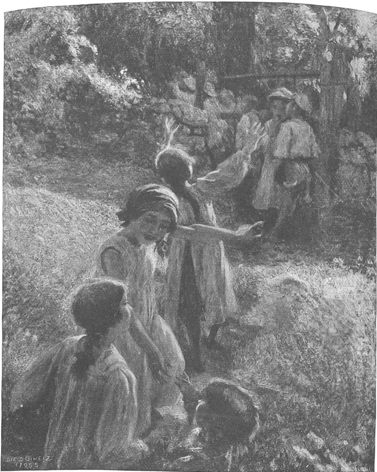
Pietro Chiela, Sagno-Mailand.