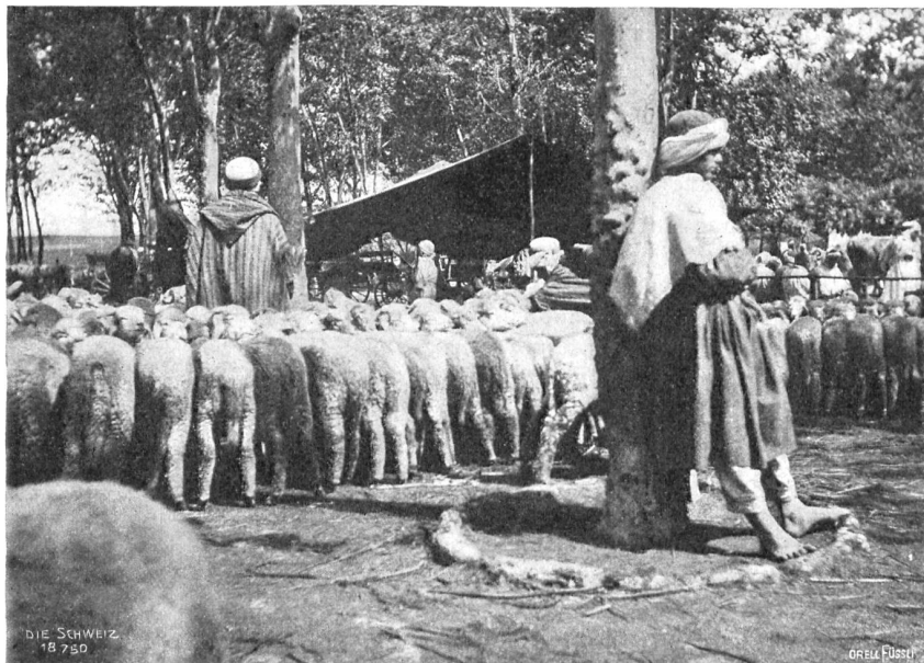
Zürich in Afrika. Viehmarkt.

In Sehenswürdigkeiten aus nachrömischer Zeit in Zürich und Umgebung hat der seit acht Jahrzehnten aufgeschüttete Kulturdünger Frankreichs soviel gezeitigt wie die moslemische Faulheit während elf Jahrhunderten: nichts. Zürich wurde aus einem großen arabischen Duar zu einem der schablonenhaften französischen Kolonialdörfer gemacht. Seine Gründung als solches fällt in das Jahr 1848. Acht Jahre zuvor warfen die gallischen Eroberer die Mauern des römischen Caesarea, die Säulen des griechischen Yol um, gaben dem alten Phönizierneft den verpfuschten Namen Cherchel. Caesarea, Yol, Cherchel ist also ein und dasselbe: der Hafen Zürichs, wenn er auch drei Wegstunden von ihm entfernt liegt. Eines Tages landete ein mit französischen Auswanderern vollgestopfter Dampfer, die sich zwei Städte zur gleichen Zeit erbauen wollten: Zürich und Kovi. Da sie sich natürlich lieber in ein fertiges Nest setzten, so kommt es, daß auch heute noch