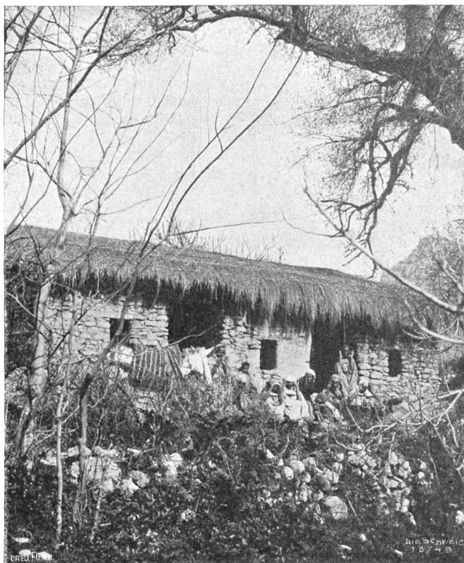
Zürich in Afrika. Im Duar.

die Eingeborenen sich dort in der Mehrzahl befinden. Daneben gibt es Spanier und Italiener, alles in allem übersteigt die Einwohnerschaft Zürichs nicht einige Hundert. Den Vorrang behauptet selbstverständlich die europäische, die katholische Religion; die Eingeborenen müssen zur Ausübung ihres Kultus