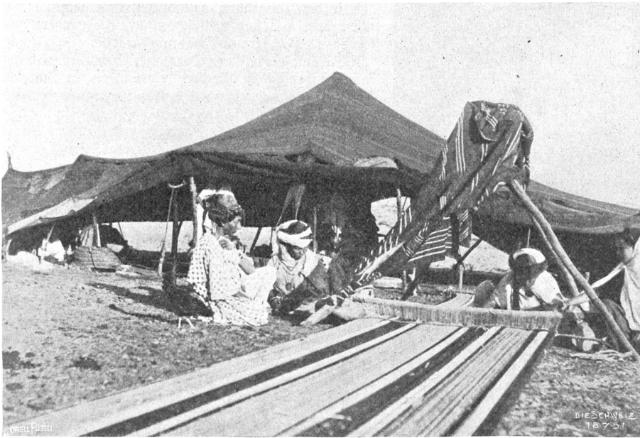
Zürich in Afrika. Am Webstuhl.