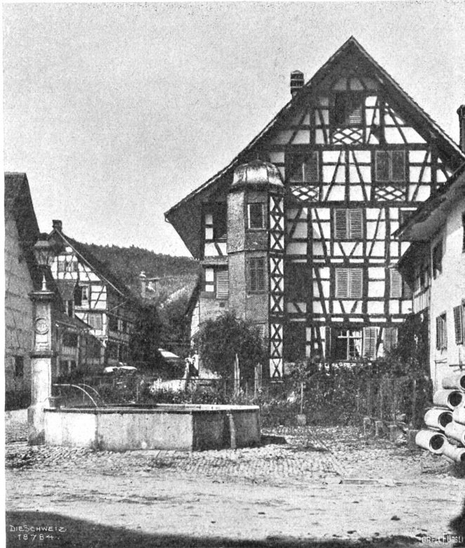
Oberflammheim (Kt. Zürich). „Sütschen“.