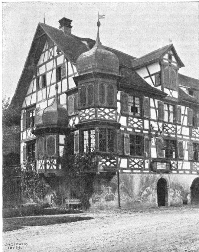
«Drachenburg» zu Gottlieben im Thurgau.