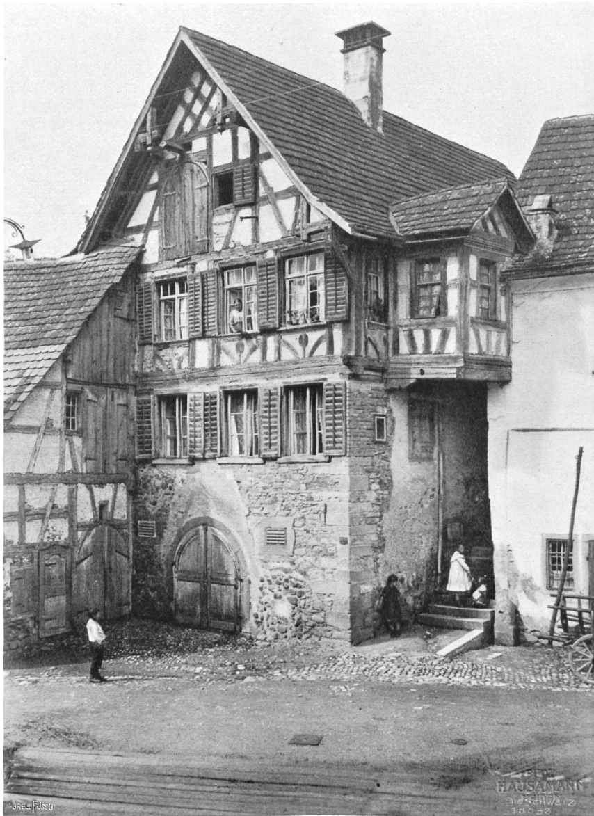
„Im Klösterli“ zu Steckborn.