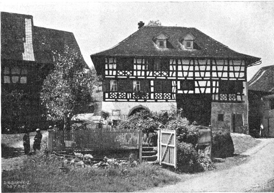
Hus Amlikon im Thurgau. Kegelhaus mit Baumgärtchen.

Diese Improvisationen — denn schließlich ist jede Karikatur eine solche — waren so reizvoll und geistreich ausgeführt, daß es der berühmten Namen darunter nicht bedurfte hätte, um mir zu verraten, daß die Urheber Meister ihres Faches. Gerade der Mut, das Fabelhafte und Lächerliche zu verewigen, ist der wahre Mutwille des Künstlers, der seine Einfälle festspielt wie den flüchtigen Schmetterling auf der Nadel.