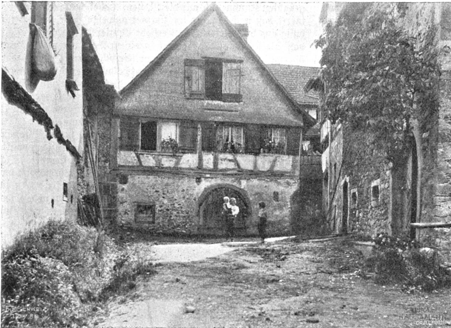
Weier bei Steckborn. „Höflein“.