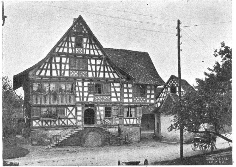
Oberaach bei Amriswil (Thurgau). Wirtshaus.