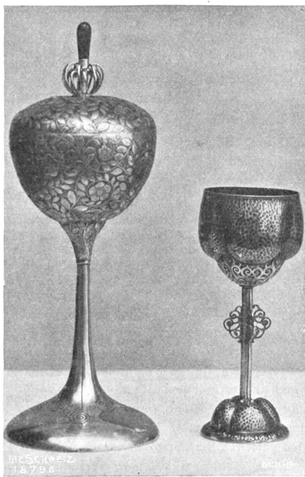
Arnold Stockmann, Luzern. a) Handgetriebener Becher des Regattaverzins Luzern mit Zifferierung (stilisiertes Rosenbäumchen) und mit grünem Jaspis als Deckelgriff; b) Handgetriebener Becher, teils zifferiert, teils gefämnert.