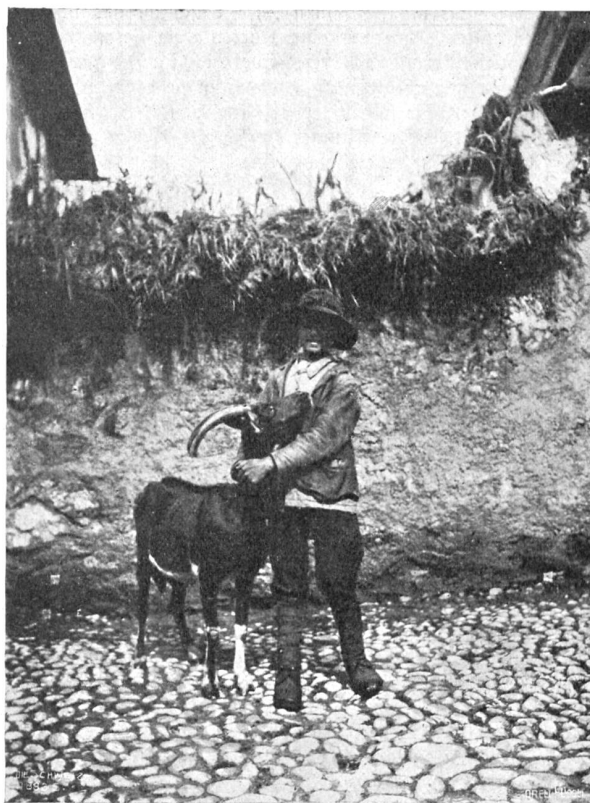
Ziegenhirt aus Bergamo.

Eine Woche war vergangen und hatte die Aufregungen des Schlittenausflugs verwischt. Wir näherten uns Weihnachten, und da ich die Festtage bei meiner guten Mutter verbringen wollte, machte ich mich eines Nachmittags daran, meine Sachen zur Reise zu packen. Da kam die gute Hofrätin ganz entsezt und erregt zu mir herein und erzählte in heftigen