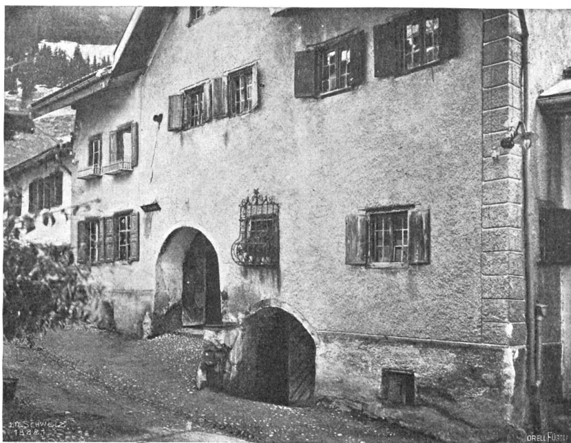
Saus im innern Albulatal.

Zwischen den beiden Rundbogenöffnungen ladet die für das Engadinerhaus typische steinerne, mit Holz belegte Bank zur Siesta ein. Hier pflegen die Hausbewohner zur Sommers-