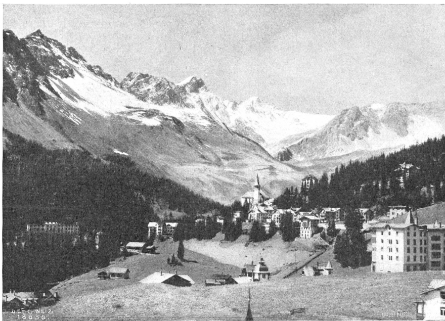
Arosa im Sommer, von Balsana aus.

Der Postplatz, den die Kutsche gleich darauf erreicht, ist das eigentliche Zentrum des Ortes. Doch obwohl hier die meisten Reisenden froh und erleichtert den Kumpelkisten verlassen, ist's noch nicht das Ende der Straße. Im Gegensatz zu dem um Ober- und Untersee liegenden sog. Außer-Arosa, das erst in den letzten fünfzehn bis zwanzig Jahren entstand, ist Inner-Arosa mit der Endstation der Post das ursprüngliche Dorf. Nur eine große Alp ist's, dies uralte Inner-Arosa, und über und über mit dunkelbraunen Hütchen und Ställen besät. Hoch oben ein bescheidenes Kirchlein mit altersgrauen Mauern und moosbewachsenem Holzturm. Durch enge Bogenfensterchen gleitet ein spärliches Licht ins Innere, wo früher Gott zur Ehre gebetet und gesungen wurde. Früher — denn seitdem die neue Kirche erbaut wurde, bleibt es geschlossen. Bei den Toten hält es getreulich Wacht, die auf dem Friedhof ringsum den ewigen Schlaf schlafen. Ganz still ist's hier. Nur die verrostete Windfahne stöhnt hin und wieder leise auf, oder die