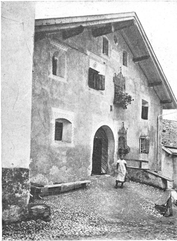
Baus in Isafsch (1590 m), ob Bergün.

der Form der Astverzweigungen: von den horizontal sich ausbreitenden Hauptästen zweigen in regelmäßigen Abständen parallel verlaufende und vertikal nach unten gerichtete Nebenäste ab.