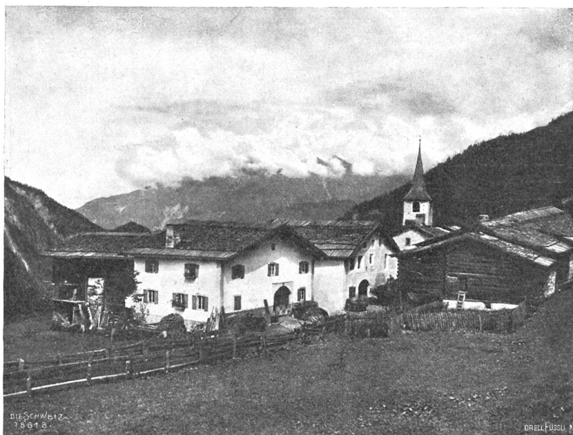
Stuls im Albulatal (1280 m).

langgestreckten Gassendorfes angenommen. Bei den deutschen Volksstämmen (Davos, Prättigau) ist das gezimmerte, bei den romanischen Völkern (Albula, Engadin) zumeist das gemauerte Haus vorherrschend. In den Sprachgrenzgebieten (Rheinwald, Domleschg) ist gar oft ein Mittelgebilde zwischen gezimmertem und gemauertem Haus zu finden.