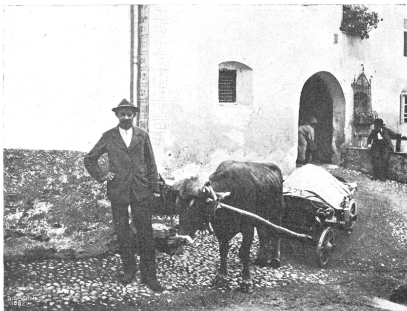
Ausfahrt einer Maientäuföhre.

verpackt und so auf starken Schultern oder auf dem Leiterwagen nach Hause verbracht wird. Und wir erfahren auch, wie hier Gemeindeviehhirt und Gemeindegiegenhirt zumeist Bergamasker sind, die sich gegen guten Lohn für einen ganzen Sommer anwerben lassen (vgl. Abb. S. 475 u. und 477 o.).