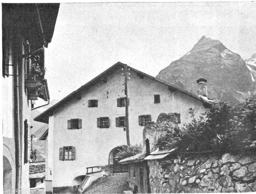
Haus bei Bergün.

Das charakteristische Merkzeichen des alten Engadinerhauses sind aber die beiden großen Rundbogenöffnungen für die Cuort (Stall- und Kellerräume) und den Suler (Vorraum).