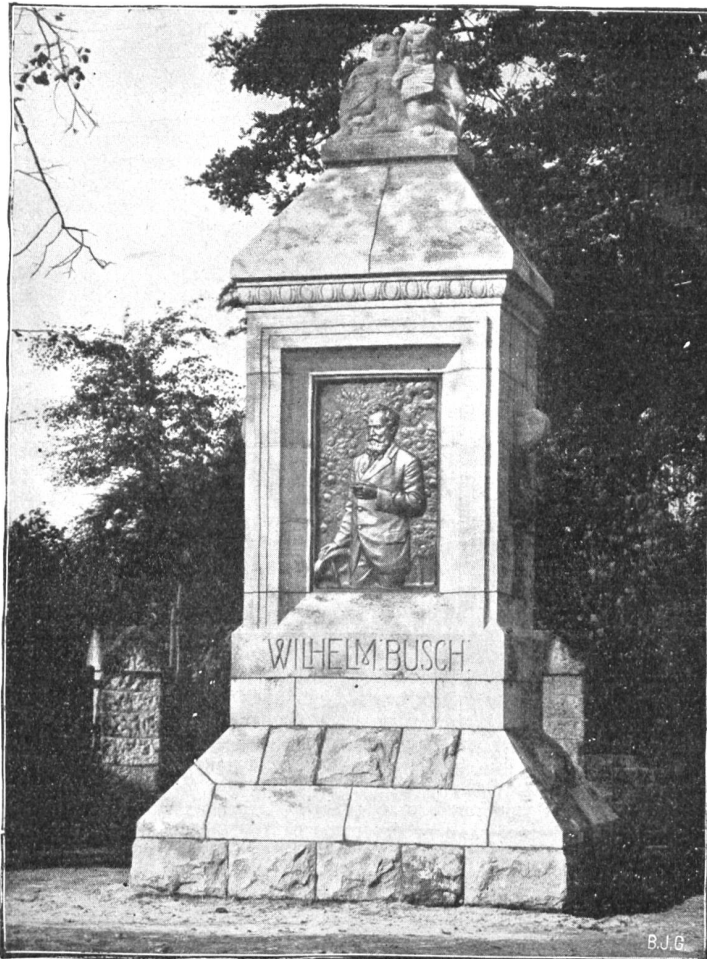
Das Wilhelm Busch-Denkmal in Wiedensahl.

stabenhöhe der Inschrift über dem Relief beträgt 1 Meter 80. Das in Pyramidenform sich aufbauende Denkmal enthält im Innern eine Kuppelhalle von 68 Meter Höhe, in der ein ganz ansehnlicher Kirchturm Platz fände. In der Krypta sind acht Pfeiler eingebaut, die in fünfeinhalb Meter hohen Schicksalsmasken endigen, an jedem Pfeiler stehen je zwei Krieger von je dreieinhalb Meter Höhe; in der Ruhmeshalle sitzen vier allegorische Kolossalfiguren von 9,60 Meter Höhe, welche die Opferfreudigkeit, die Tapferkeit, die Glaubensstärke und die deutsche Volkskraft darstellen. Der Kopf jeder dieser Figuren ist durchschnittlich 1,65 Meter groß, die Schulterbreite mißt 4 Meter, ein Mittelfinger 1,10 Meter, die Fußlänge 2,25 Meter und die Fußbreite 1,25 Meter. Die „Tapferkeit“ mißt von der Ferse bis zum Knie 4 Meter; zwei sehr große Männer aufeinanderstehend würden also erst an das Knie hererreichen. Die vier Figuren kosten etwa 360,000 Mark. Zu jeder Figur waren über 5000 Zentner Granit erforderlich. An diesen vier Figuren allein wurde mehr als drei Jahre gearbeitet.