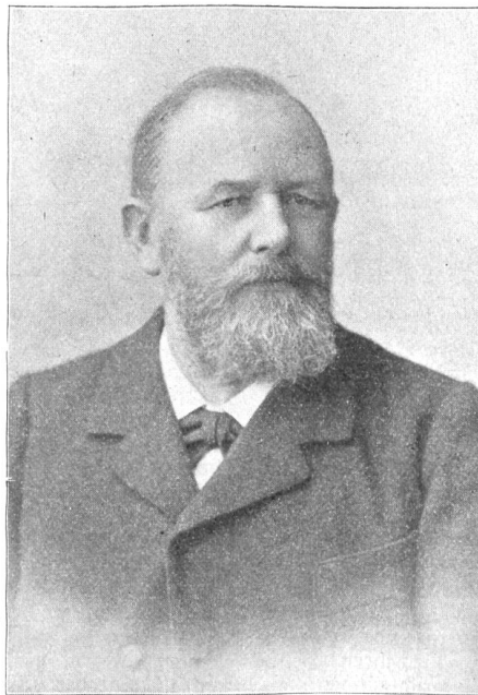
† Alt-Nationalrat Oberst Emil Moser (1837—1913).

Die Denkmalfeier in Leipzig vollzog sich in dem üblichen Rahmen, hinter einem für das große Publikum undurchdringlichen Schleier von Wachmannschaften, die die 29 Fürsten vor allen Gefahren zu schützen hatten. Eine tiefer gehende Anteilnahme der großen Massen an der Erinnerungsfeier scheint denn auch nirgends hervorgetreten zu sein.