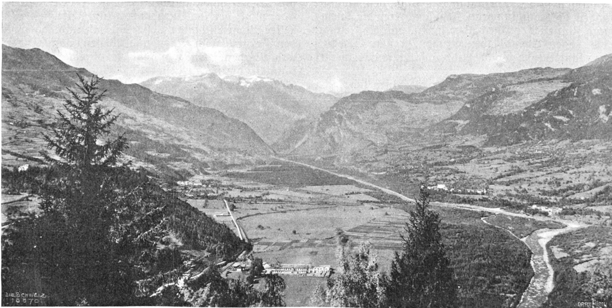
Das Domleithg von Bohenrätien aus.