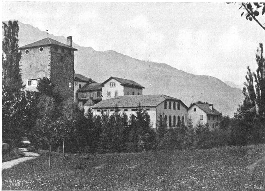
Rietberg ob Rodels (im innern Domleschg), von der Almenfer Seite.

Ein wilder Windstoß, der die Höhen herabgedonnert kam und die Pappeln am Weg halb zur Erde neigte, die Apfelbäume zaufte, daß die kahlen Nester knackten, und pfeifend durch die Fugen und Ritzen der Dächer tobte, weckte sie auf aus ihren Träumen. Sie wollte schlafen, ein letztes Mal schlafen. Aber sie fand keine Ruhe. Die Gedanken wälzten sich in ihrem Kopf. Ein Entschluß neigte zur Reife, und Pläne über das Wie ließen sie nicht los. Morgen, ganz früh, wollte sie zum Herrn Pfarrer eilen und ihm sagen, daß es nicht sein soll. Sie wollte ihm gestehen, alles, alles wollte sie sich von der Seele herunterbeichten. Möchten sie sagen, was sie wollten, die andern. Möchte geschehen, was geschehen mochte. Nur nicht diese Lüge, diese große, schändliche Lüge! Ob sie den Mut habe, zu tun, was sie tun wollte? Und Mutter? Was hatte sie gelobt? Was hatte sie geschworen? Mutter!?