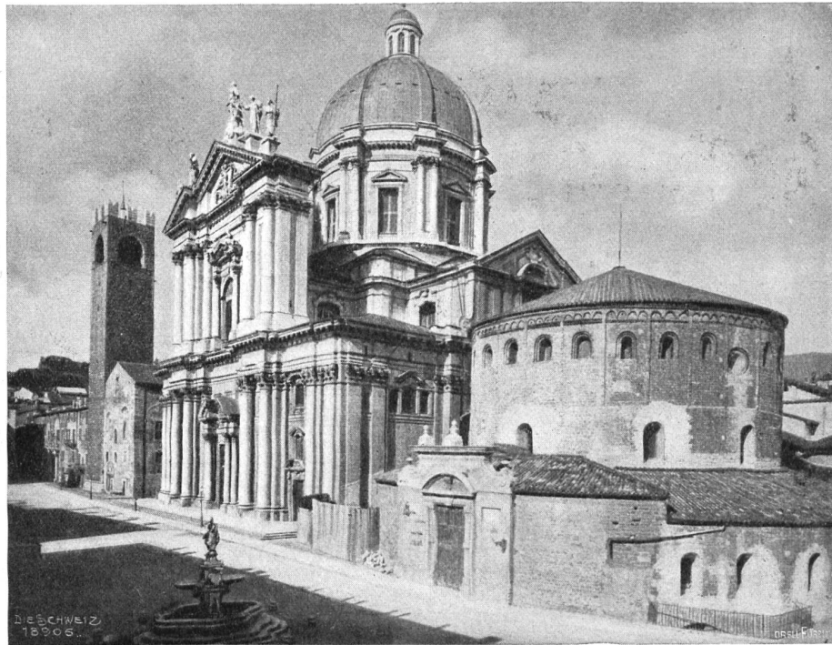
Brescia Abb. 1. Domplatz. In der Mitte der Dom (Duomo nuovo), l. der Broletto mit «Torre del Popolo», r. die «Rotonda» (Duomo vecchio).