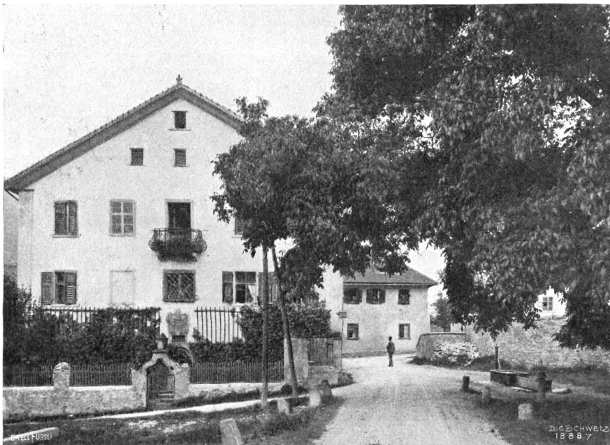
Haus in Rodels im Domleschg.