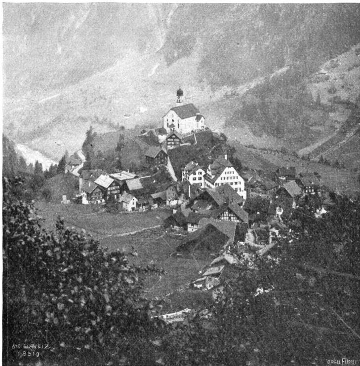
Gebrüder Pflizer, Zürich. Gasthof Ochsen und Post Waffeln im Gesamtbild des Dorfes.

In der Frühe des folgenden Tages begann Aghions Arbeit. Es erschien und wurde ihm von Bradley vorgestellt der schöne dunkeläugige Jüngling Vhardenna, der sein Lehrmeister in der Hindostani-Sprache werden sollte. Der lächelnde junge Indier sprach nicht übel englisch und hatte die