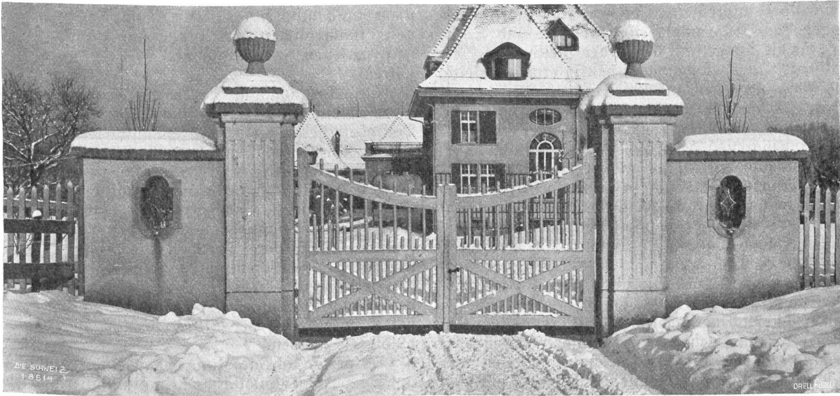
B. Stadt, St. Gallen.