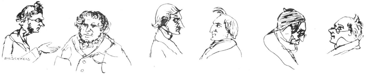
Aus J. V. Widmanns Skizzenheften.

Oft sahen wir in lauen Sommernächten Auf eines hohen Turmes enger Zinne, Einsam — gleich war ihr's, was die Leute dächten — Dann frug sie mich, ob Attraktion und Minne Bei Sternen nicht identisch, beide brächten Daselbe ja zustande. Meine Sinne Vergingen mir vor ihrer Schönheit Wonne, Ich stund — wie Butter an der Julisonne.