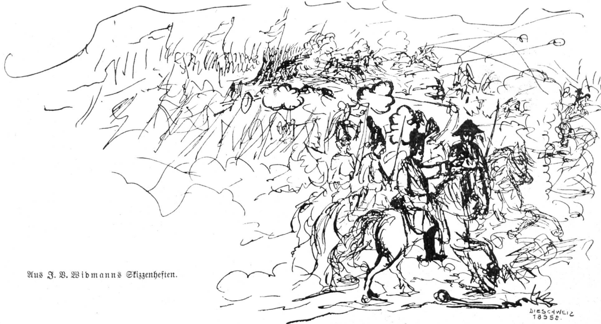
Aus J. B. Widmanns Skizzenheften.