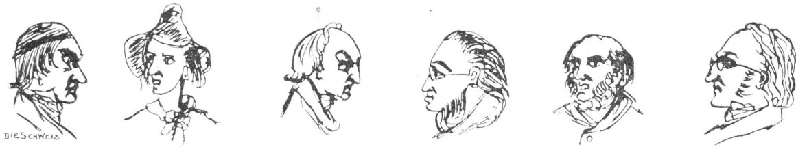
„Deutsche Schulmeister- und Professorengeichter“.

Sie hatte mich an meinem seid'nen Zaume — Ihr Gürtel war's, den ich im Munde trug — Ganz unvermerkt gelenkt zu einem Raume, Wo hohes Gras mir um die Augen schlug; Ich kroch dahin, betäubt als wie im Traume, Da hielt sie rasch mich an mit kurzem Zug, Und das Gelächter schlug mir an die Ohren, Der ganze Hof — o Gott, ich war verloren!