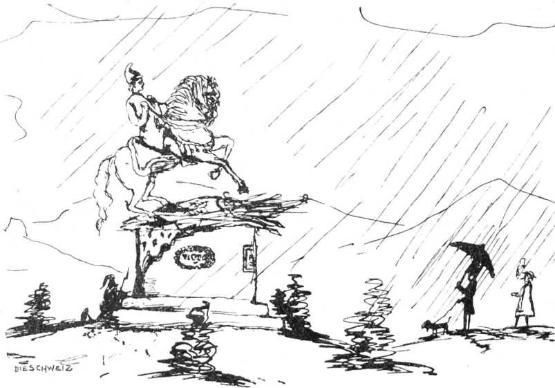
Aus J. V. Widmanns Skizzenheften.