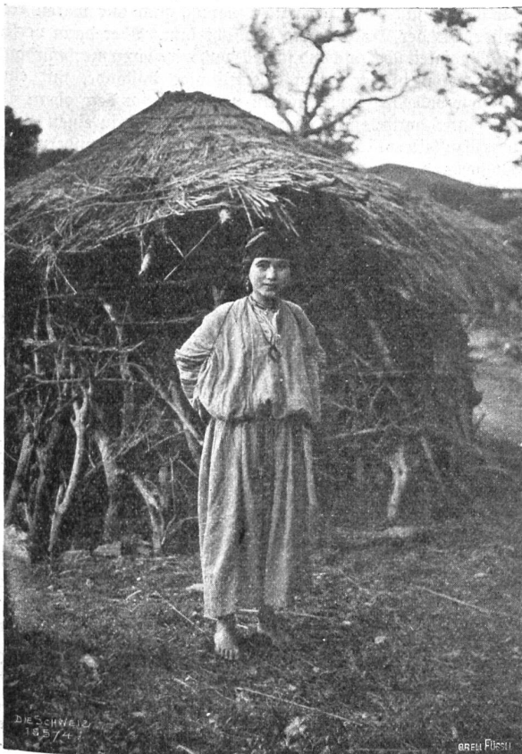
Im Schneegestöber über den Atlas Abb. 6. Eine kabylische Schönheit.