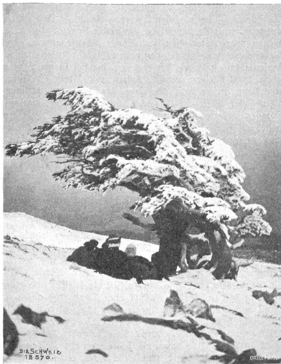
Im Schneegestöber über den Atlas Abb. 3. Raft unter der tausendjährigen Zeder.

Um vier Uhr war Tagwache, und bis halb sechs Uhr dauerte das Frühstück. Am Abend zuvor wunderbarer Stern-