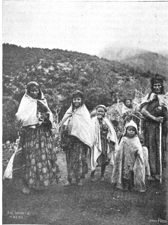
Im Schneegestöber über den Atlas Abb. 7. Kabylische Frauen und Kinder.

Heute galt es, in einem der Dörfer Quartier zu erhalten. Das war mit Schwierigkeiten verbunden; denn ein Mohamedaner durfte uns der Landesitte gemäß nicht aufnehmen,