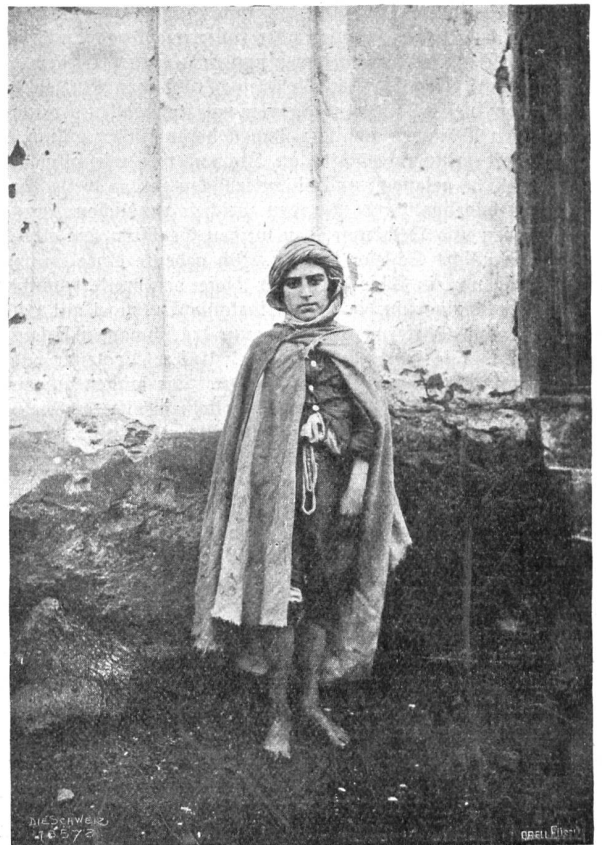
Im Schneegestöber über den Atlas Abb. 5. Der Musterschüler von Ain-Zada.

Wetter wäre eine Kletterei eine willkommene Abwechslung im Reiseprogramm gewesen, selbst für diejenigen ohne Stod und genagelte Schuhe; denn der Fels ist gut. Jedoch diesen Verhältnissen ist unsere Ausrüstung nicht gewachsen. Unverdrossen rutschen wir trotzdem talwärts, sorgfältig die steilen Bänder vermeidend. Aber die Füße gehorchen nicht; die