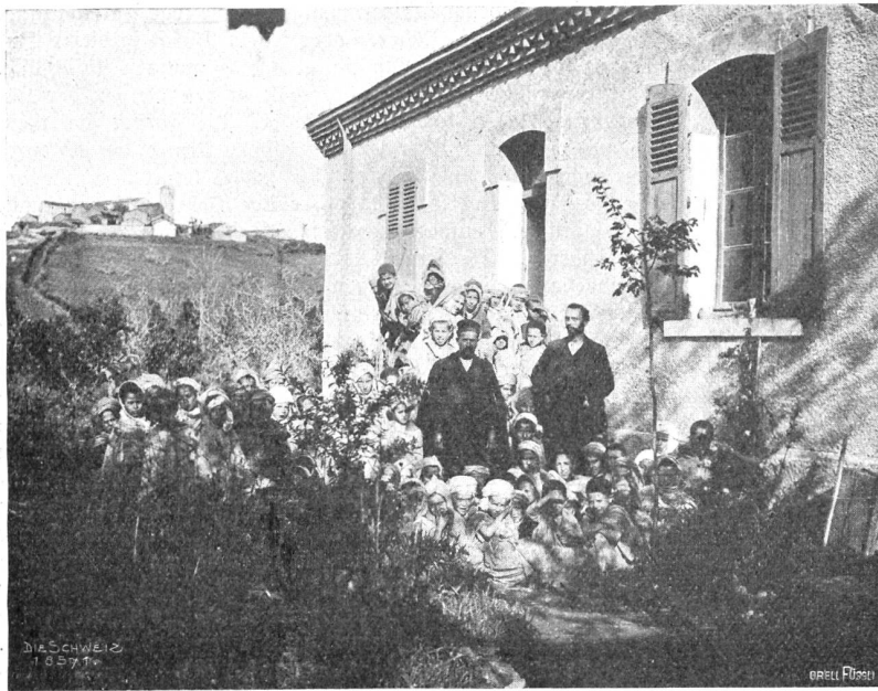
Im Schneegestöber über den Atlas Abb. 4. Eine Schule in Ain-Zada.