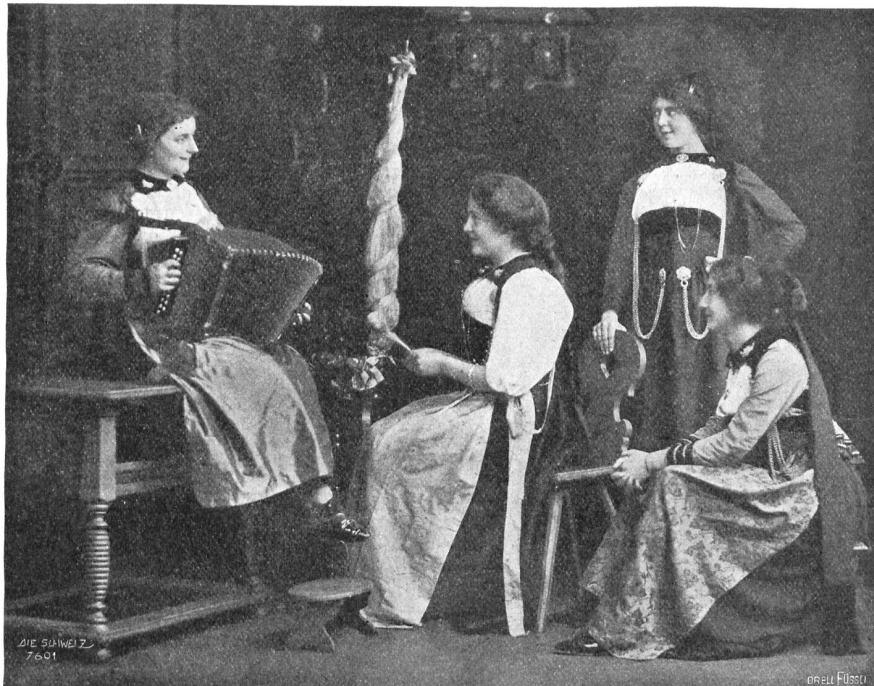
Kavauer Köseligartengruppe.

Gar oft hört man die Frage: Was ist schöner, der Kaukasus oder die Alpen? Je nun, das ist nicht leicht zu sagen. Zweifellos besitzt der Kaukasus, namentlich im zentralen Teil, Partien von grandioßer Schönheit; in der Dschangagruppe sinkt auf 25 Kilometer Länge die Kammlinie nie unter Montblanchöhe. Die Vergletscherung ist im zentralen und westlichen Teil eine intensivere wie in den Alpen; aus jedem Couloir heraus quillt ein grüner Hängegletscher; auf jeder Terrasse bilden sich mächtige Eisbalkone,