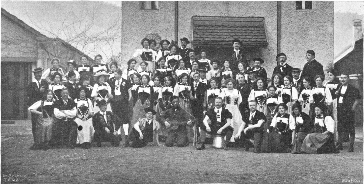
Harauer Hölzligartengruppe.