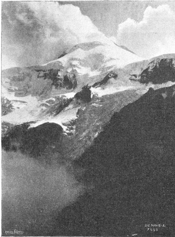
Der Kasbek (5043 m) von der Jermoloffhütte aus gesehen.

Den Mitgliedern der Reisegesellschaft, die unter Professor Niklis Führung den Kluchorpaß vom Schwarzen Meer zu den nordkaukasischen Bädern überschritt, bot sich die seltene Gelegenheit, einen Einblick in das wenig bekannte Gletschergebiet des westlichen oder abchasischen Kaukasus zu tun. Man pflegt allgemein die das Kodortal im Süden des Hauptammes mit der Teberdafurche im Norden desselben verbindende Depression des Kluchorpasses als die Scheide zwischen westlichem und zentralem Kaukasus anzunehmen. Die Gründe hierfür sind nicht nur konventioneller, sondern vielmehr morphologischer und geologischer Art; als zentralen Kaukasus bezeichnet man die zwischen den gewaltigen Eruptivzentren des Elbrus im Westen und des Kasbek im Osten auf eine Länge von 200 Kilometer sich erstreckenden Faltencharen, die vorwiegend aus kristallinen Gesteinen bestehen.