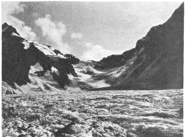
Kluchorgletscher.