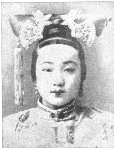
Lungjü, die verstorbene Kaiserin von China.

in diesem mit echt asiatischer List geführten Spiel ohne Zweifel die Siegerin geblieben, wenn nicht die große Revolution allem ein Ende bereitet hätte. Als diese im Süden ausbrach, suchte Lungjü sie mit allen Mitteln zu unterdrücken. Aber der „Sühneprinz“ Tschun, der damals noch als Regent für den jugendlichen Kaiser amtierte, ließ sich nach den ersten Mißerfolgen auf jene Verhandlungen ein, die bekanntlich zur Beseitigung der Mandschu-Dynastie geführt haben. Vergebens suchte Lungjü die Mandschu-Prinzen zum Kampf anzufeuern, sie fühlten sich nicht stark genug, dem Einflusse Juanschitais zu begegnen, in dem Lungjü den Feind der Dynastie erkannt hatte. Erst nach langem Widerstreben und als sie sah, daß sie die Dynastie nicht mehr retten konnte, hat sie ihre Unterschrift unter die Abdankungsurkunde gesetzt und sich in die „Verbotene Stadt“ zurückgezogen, in der sie den Sturz ihres Hauses nun faum um ein Jahr überlebt hat. X