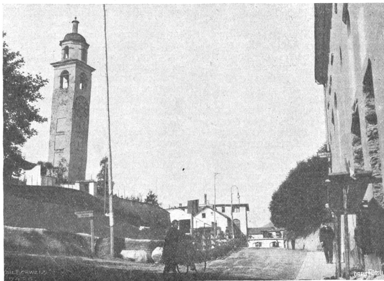
Der schiefe Turm von St. Moritz.

die bekanntesten französisch-schweizerischen Straßenfahrer für Zürich-München melden, sodas eine interessante internationale Besetzung zu erwarten ist. 1911 ging Paul Suter vor dem Berliner Wittig mit 2 Sekunden Vorsprung in München mit der Fahrzeit 12:2:50 übers Band, letztes Jahr schlug er seinen Landsmann Robert Chopard aus Biel mit 5 Sekunden Vorsprung und einer Fahrzeit von 12:28:48, da das Rennen unter geradezu sintflutartigem Regen ausgefahren werden