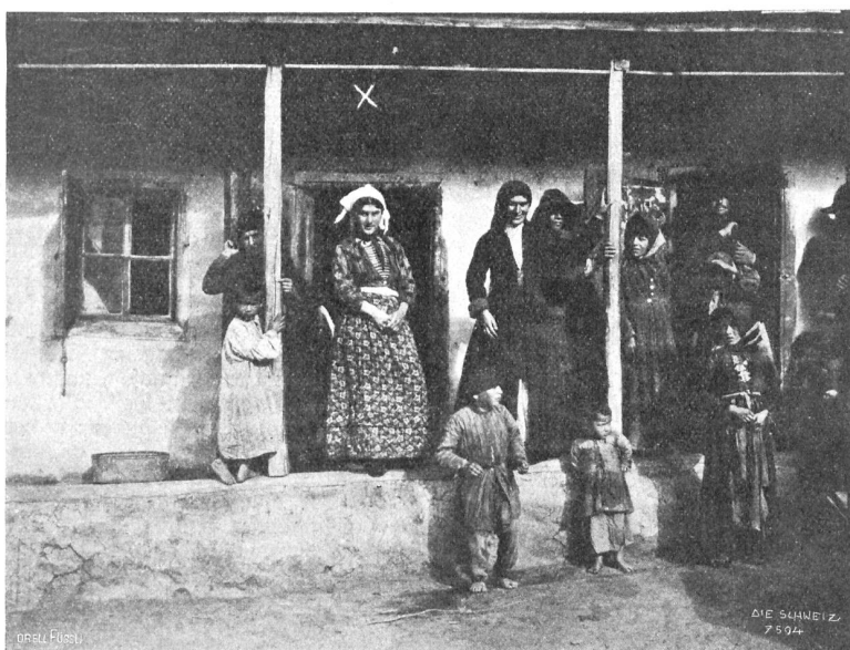
Unsere Wirtin in Marinsk.

Leider mußten wir den Aufbruch am 11. August bis morgens drei Uhr verschieben, da das schwer zu begehende Terrain klares Sehen unbedingt erforderte. Es dauerte geraume Zeit, bis wir drüben auf dem wild zerrissenen Buulgengletscher standen. Bald war dann die Ausmündung des von einer Scharte des Nordgrates herabziehenden Riesencouloirs erreicht; die greuliche Kluft, die das Couloir vom Firn trennte, machte uns viel zu schaffen, ebenso das außergewöhnlich steile und steinschlaggefährdete Couloir, dessen Ueberwindung vierstündiges Stufenschlagen erforderte. Gegen Mittag standen wir oben auf der 3700 m hohen Scharte, von der aus sich eine unermessliche Aussicht über die westlichen Kluchorberge eröffnete. Im Osten war es wieder der majestätische Elbrus, der aller Augen auf sich zog. Sehr schwierig gestaltete sich die Erkletterung des Schlußgrates, der noch über dreihundert Meter zu mächtigen überhängenden Türmen sich aufschwang. Totale Vereisung der brüchigen Felsen erforderte peinlichste Vorsicht. Dessenungeachtet ereignete sich kaum siebzig Meter unter dem ersehnten Gipfel um zwei Uhr nachmittags durch Ausbrechen eines Blocks ein kleiner Unfall, der leicht schwere Folgen hätte haben können. Er zwang uns zu sofortigem Abstieg, der bei größter Aufmerksamkeit in tunlichster Eile sich vollziehen