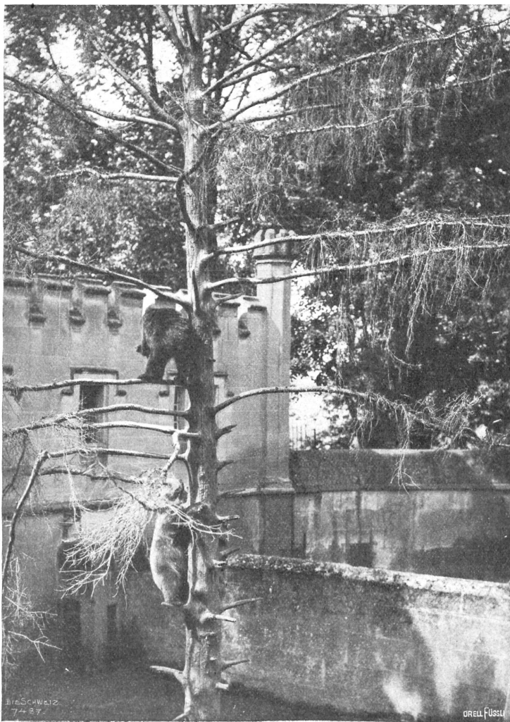
Der Bärengraben in Bern.

blicken vernichtete. Die meisten, nämlich 29, verunglückten in den Tiroler Bergen, 15 in Niederösterreich, 10 in der Steiermark und 8 in Salzburgs Umgebung. Der Rest verteilt sich auf Bayern und die Schweiz, die diesmal erfreulicherweise nicht stark in der Liste vertreten ist. 53 Personen sind durch Absturz verunglückt, darunter der größere Teil bei reinen Klettertouren, 13 durch Lawine, 8 fanden den Tod durch Erfröhen, bei 8 war die Todesursache nicht zu eruieren, die übrigen kamen durch Steinschlag, Ueberanstrengung, Erschöpfung, Sturz in Gletscherspalten, Ausbruch von Schneewächten usw. ums Leben. Unter den 95 Toden des Jahres 1912 finden sich auch 6 Damen, unter den Opfern in der Schweiz Dr. Andreas Fischer von Grindelwald, der bekannte Alpinist, der im Kaukasus eine Reihe schwieriger Hochtouren ausführte.