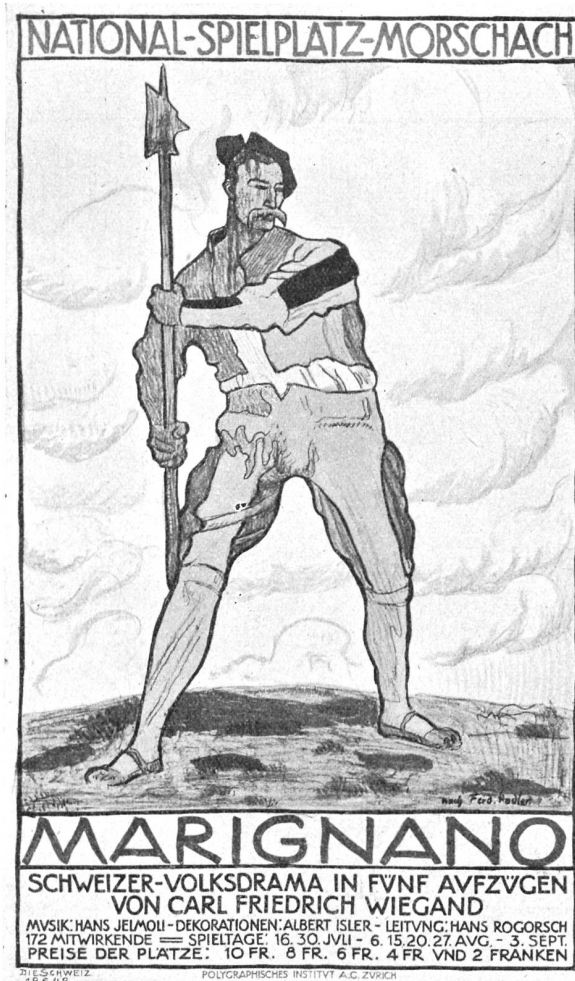
Ernst Würtenberger, Zürich. Plakat für die Marnignano-Aufführungen in Morschach (1911). Druck: Polygraphisches Institut A. G., Zürich.

Ich lebe; aber in mir innen ist viel erstorben. Viel — ich weiß nicht, was alles es ist. Dafür habe ich keine Worte . . .