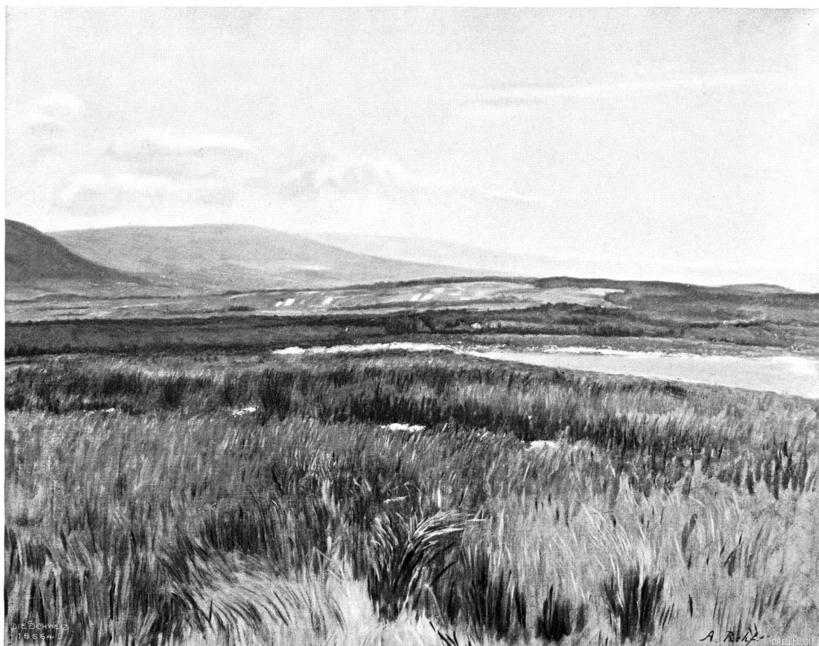
Alfred Rehfous (1860—1912).