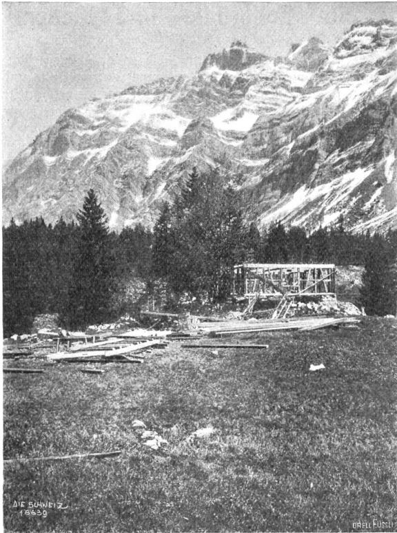
Die Hütte der Arbeiter-Naturfreunde am Säntis im Bau; im Hintergrund der Säntis.

großen Herde flackerte ein helles Feuer, auf dem gerade die obligate Abendsuppe zu brodeln begann. Der Raum hatte Platz für mindestens dreißig Personen; ein hoher Schrank enthielt Kochgeschirr, Tassen, Kannen, Teller, Messer, Gabel, Löffel u. für etwa fünfzig Personen, und in langen Reihen standen an der Wand wohl sechzig Paar „Endesinken“, warme gefüllte Holz- und Filzpantoffeln in allen Größen zur Auswahl für die Besucher. An der Decke hing eine große Petrolampe, an den Wänden sah man schöne Bilder aus der schweizerischen Alpenwelt, Sinnsprüche, Scherzinschriften, Tannzapfen und andere Kinder unserer Alpenflora. Da wir müde waren, gingen wir alsbald ins Heu hinauf. Aber wie erstaunten wir, als wir anstatt der üblichen Heulager ganz vorzügliche Schlafstätten fanden, Heupolster mit überspanntem Segeltuch nebst dicken warmen Wolldecken, soviel man wünschte! Und welche peinliche Ordnung und Sauberkeit hier herrschte! Wir waren überrascht und erstaunt zugleich und haben in dieser Nacht wirklich großartig geruht.