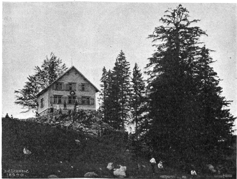
Die Bütte der Arbeiter-Naturfreunde am Säntis.

und Liebe, kaum daß sie sie zu fassen glaubt, immer wieder zerrinnen, vermag sich in dem Schwulst von hohler Theatralik und verlogenen Pathos nicht geltend zu machen. Zwischen diesen beiden robusten und lauten dramatischen Erzeugnissen stand Maeterlincs „Aglavaine und Selysette“. Lieft man die rührende Geschichte von der armen kleinen Selysette, die um das Glück ihres Gatten und der von ihm geliebten Frau nicht zu stören, eigenes Glück und Leben opfert, wird man wundersam ergriffen von diesen Szenen voll vibrierender Innigkeit, von dem süßen Duft, der ihnen entströmt. Aber man legt auch das Buch mit einem Zweifel an die Bühnenfähigkeit des Dramas aus der Hand; man fragt sich, werden diese stillen Zwiegespräche, durch die ein leises Beben gequälter Seelen wie das Zittern einer Saite geht,