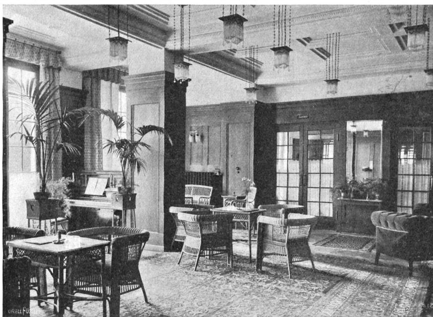
J. Huster Mayer & Daulte, Lausanne. Halle im Hotel Montana, Lausanne (Aug. 1912 erbaut).

ment geführt hat, liegt im Sterben. Sie kämpft einen schweren Todeskampf, weil die junge Gritt im Streite lebt mit dem schwachen verheirateten Bruder und der heißblütigen Schwägerin Leuni. Sie läßt deshalb auch den fest mit dem Hause verwachsenen Knecht ans Sterbebett rufen, und der tut ein Gelöbniß, zu dem Hof und der Gritt Sorge zu tragen gegen die Schwachheit des Bruders und gegen die Feindschaft der Schwägerin. Da die Ehe der Leuni kinderlos ist und bleiben wird, fürchtet sie, der Hof könnte einmal an die Kinder der Gritt übergehen, die mit einem Säuger Bekanntschaft hat. Der Knecht schützt die Gritt gegen die Ränke ihrer Schwägerin und unterstützt den Sägemüller in seiner Bewerbung. Nun erscheint zur Zeit der Heuernte ein flüchtiger Colmarer auf dem abgelegenen Hof. Zu allen Winden, und der Himmelspacher stellt ihn für einige Tage als Mäher ein. Die Gritt verliert ihr Herz an den Burschen und läßt sich betören, nachdem er ihr Treue und Wiederkehr aus fremden Kriegsdiensten geschworen. Die Leuni, die um alles in der Welt einen Leibeserben haben