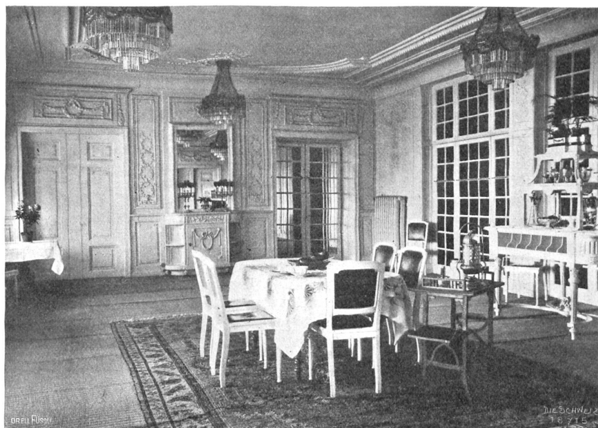
H. Bringolf, Luzern. Restaurant im Carlton-Hotel Tivoli, Luzern.

Die Himmelspacher sind, das darf ohne Uebertreibung gesagt werden, ein Kunstwerk von seltener Reife und Schönheit. Frei von jeder Pose und Effekthascherei scheint Stegemann stets natürlich und gesund und in all seiner Kraft und Ge-