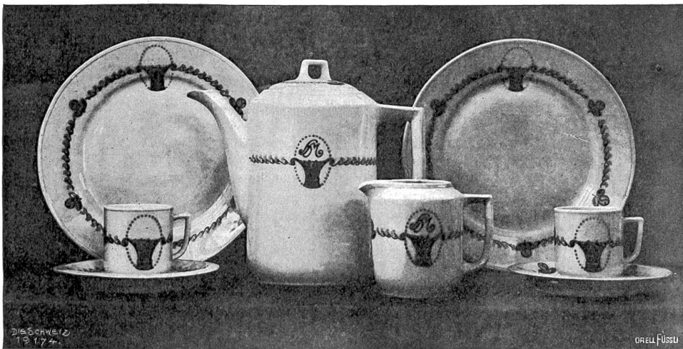
Teeservice aus der Porzellanfabrik Langenthal A.-G. in der Abteilung für Keramik der Schweiz. Landesausstellung.

deren Erzeugnisse uns zuerst als alte Bekannte beim Eintritt in die keramische Halle begrüßen. Freilich ist, trotzdem sie sich in schöner Aufmachung reich und in Form, Farbe und Dekoration vielseitig darstellt, die Töpferkunst nicht so stark vertreten, wie ihre Bedeutung es erheischt hätte. Wir finden noch vielerorts im Lande, so zwischen Genf und Lausanne (Vernex), in Bernegg, Bonfol, Langnau, hauptsächlich aber in der Gegend Heimberg, Steffisburg, Thun, Safner, die, wenn auch unbewußt, über ein derartiges handwerkliches Können verfügen, daß ihre oft mit bewundernswertem Geschick hergestellten, zum meist der sog. Ordinarhafnerie zugehörnden Geschirre mit Ehren hier hätten bestehen können; doch freuen wir uns des Vorhandenen, das sehr viel Gutes aufweist. Sogar bei den