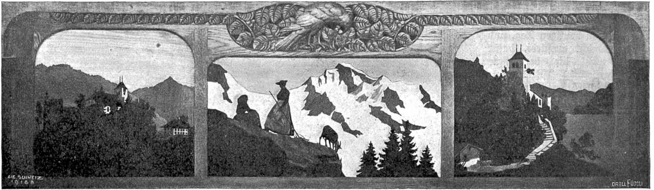
Schriften Michel, Mingenberg.