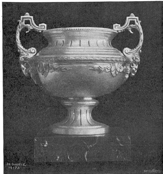
Sandzilierte Silbervase Louis XVI aus der Silberwarenfabrik Otto & Albin Wissemann, Zürich, an der Schweiz. Landesausstellung.

Nach Schweizer Chronometern werden die Sportstiege auf dem ganzen Erdball gemessen. Instrumente, bei denen schon die Handwärme zur Ausdehnung des Eisens genügt, er-möglichten die schier fabelhaften Präzisionschronometer, mit deren Hilfe die Zielrichter die Zeit des rasenden Bobsleighs auf Fünftelsekunden austifteln.