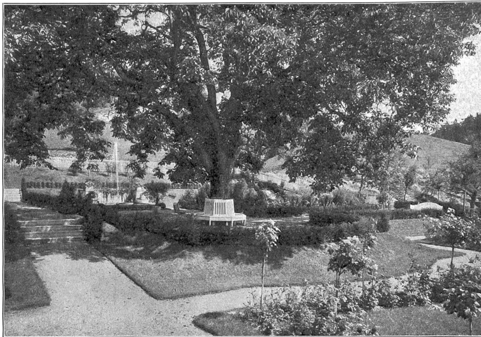
Gartenkunst. Aus dem Garten Langrain in Thun. Der alte prachtvolle Buchsbaum mit weit ausladenden Ästen wurde zum Mittelpunkt des neuen Gartens gemacht; auf dem mit Buchsbaum eingefassten Plätzchen ist um den Stamm eine weiße Bank gebaut, von wo aus der Blick über den Rosengarten und den Thunersee schweift. Entwurf und Ausführung von Ditto Froebel's Erben, Zürich.