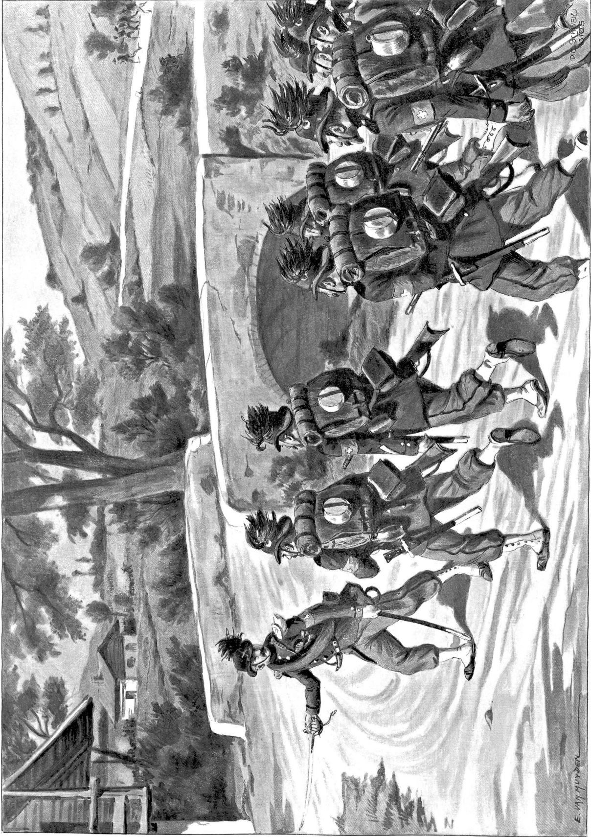
Schweiz. Soldatenbilder: Bundesstruppen 1862. Aufzeichnung von Evert van Blundert.