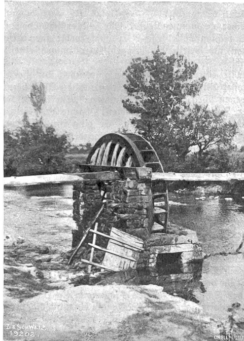
Wallerrad in der Herzegowina.