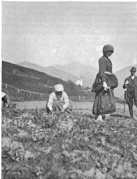
Forstdienst im Hochgebirge Abb. 1. Säen in einem Pflanzgarten des Gebirges.

Bei seinem Fortgehen hatte es die Totenstube im Finstern gelassen. Jetzt brannten zu Häupten des Sarges zwei in leere Flaschenhälse gesteckte Wachskerzen. Ein Nachtfalter umgaukelte die Lichter, und seine Flügel warfen zitternde Schatten auf das Gesicht des Toten. Ein Duffwind strich weich und lind durch die offenen Fenster ins Zimmer. Nun knisterte der Blumenhügel; es rauschten die Blätter der Kränze, die geschichtet am Boden lagen, und jetzt — jetzt hob sich aus ihnen langsam, langsam eine dunkle Weibsgestalt mit langem, offenem Blondhaar und mit dunkeln, nachtschwarzen Augen im leinenweißen Gesicht. Es war Nina, die hochverwundert das öffnende Meieli anstarrte. Wie geheimnisvolle Irrlichter flackerten ihre Augen, und das liebe Gesicht verzerrte ein Lächeln des Wahnsinns; eine unsäglich traurige Stimme stieß halb singende,