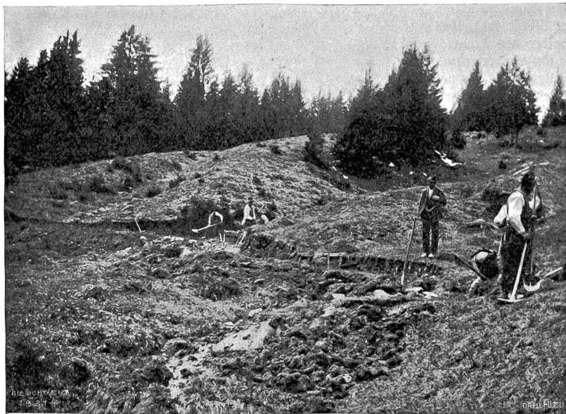
Forstdienst im Hochgebirge Abb. 2. Wegbau in der Gemeinde Unter-Tschappina.

Wenn dann der Wald in das Stadium der Nutzungsmöglichkeit tritt, hat der Forstmann in erster Linie für richtige Abfuhrgelegenheit des Holzes zu sorgen, z. B. durch Anlage von Waldwegen, Drahtseilriesen u. Auch hieran leistet der Bund einen Beitrag bis zu zwanzig Prozent. Oftmals gestaltet sich allerdings der Wegebau im Gebirge sehr mühsam und schwierig (vgl. Abb. 2); aber auch hier gilt die Losung: „Wo ein Wille, da ist auch ein Weg!“