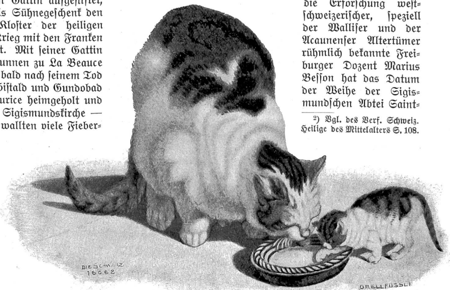
Gottfried Mind (1768–1814).