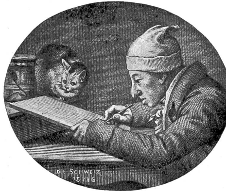
Gottfried Mind (1768–1814).

erwachte in ihm die eigentliche Begabung. „Zeichnen ist seine ganze Arbeit,“ lautete der Bericht des Schulvorstandes. So eröffnete sich dem außerhalb seiner eigensten Anlagen in merkwürdiger Unbildsamkeit verharrenden Jungen ein seiner Natur angemessenes Wirkungsfeld erst, als ihn der Berner Genre-maler Sigmund Freudenberger***) zu sich ins Haus und in die Lehre nahm. Seinem Meister in mancher Beziehung überlegen, blieb er doch stetsfort von diesem abhängig. Seinem natürlichen Schöpfertrieb mußte er zuweilen Gewalt antun mit Rücksicht auf die vorgeschriebenen Arbeiten, die er seinem Lehrer schuldete. Erst nach Freudenbergers Tod wagte es Mind, seiner eigenen Erfindungsgabe freien Lauf zu lassen. Die Witwe seines Meisters, die es verstand, sein Talent auch weiterhin für ihre Handelszwecke auszunützen, wachte sorgfältig darüber, daß ihn kein Aufmerksamere aus der eintönigen Umgebung herausriß. Mind in seiner glücklichen Beschränktheit ließ das alles in Ruhe über sich ergehen; denn ihm genügte die Gesellschaft seiner Kagen, die er ständig um sich hatte und die in allen möglichen Posituren zu porträtieren er nie müde wurde. So vermochte dieses ärmliche und auf seltsame Weise