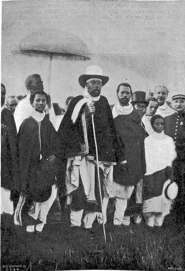
Kaiser Menelik mit Thronfolger Lidj Jassu.

hannes. Die Zukunft wird entscheiden, ob es dem Negus Lidj Jassu gelingt, seine Unabhängigkeit gleich seinem Vorgänger zu wahren. Später oder früher wird er um sie kämpfen müssen; denn Italien hat seine aethiopischen Pläne noch nicht aufgegeben.