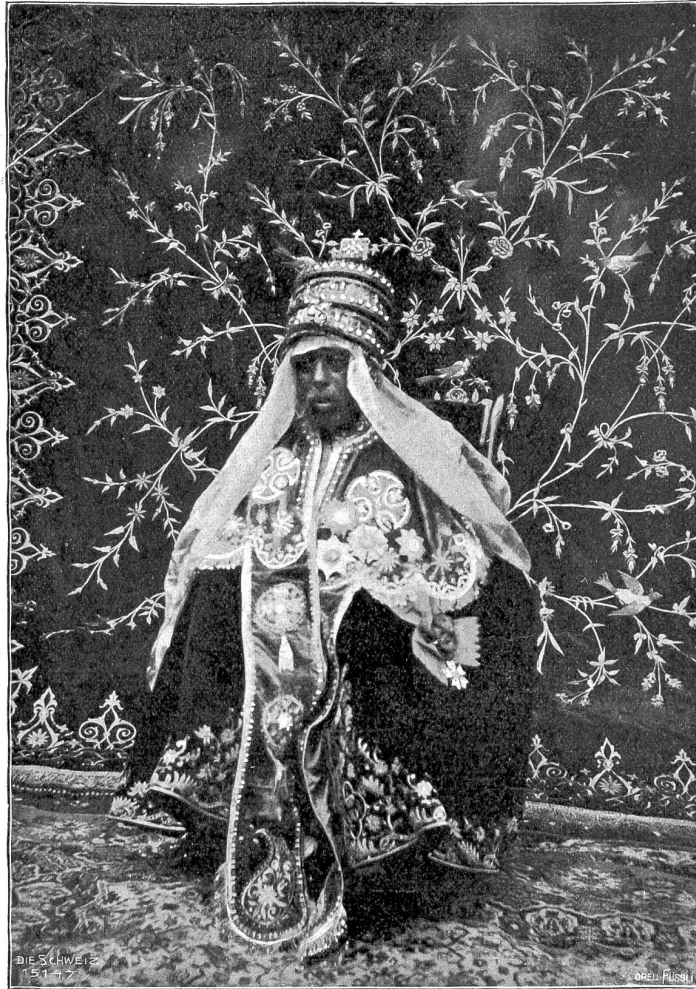
Kaiser Menelik im Staatsornat bei hohen Empfängen.