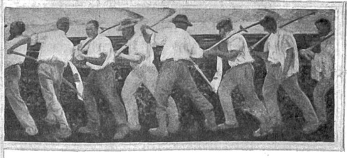
Solidarité, liberté, égalité (Triptychon).