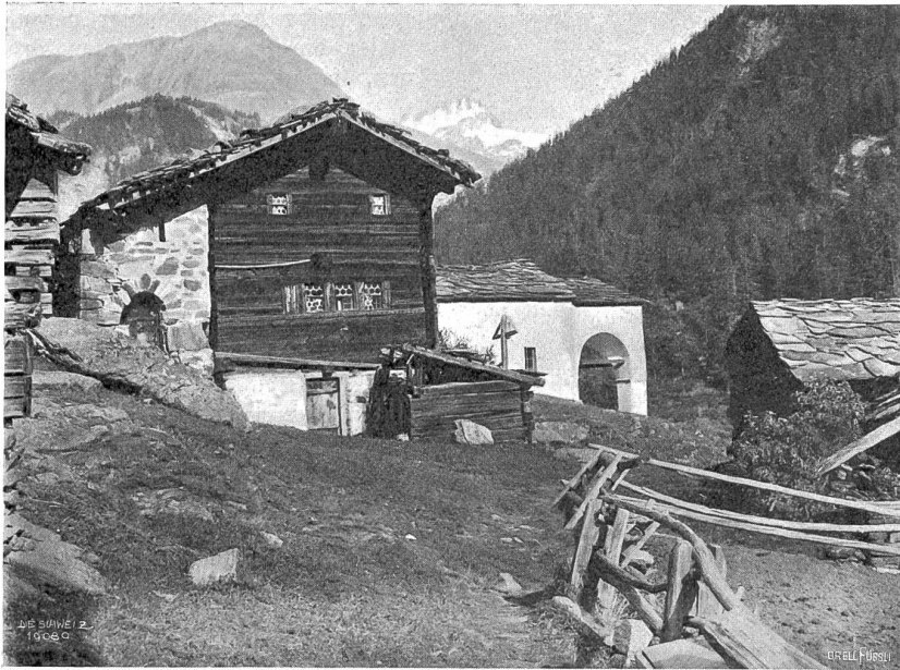
Im Dorfe Findelen (2075 m, mit den höchsten Getreidefeldern der Schweiz) ob Zermatt.

der selbstgebraute Tee! Dann erzählen wir uns, spinnen wie echte Teerjaden ein langes Garn und kriechen endlich, nicht ohne Wechsen und Verdrehungen, unter Deck in den engen Kielraum. Auch auf alten Segeln ruht es sich gut. Einer hält Wache. Nie bin ich der Natur näher gewesen als auf einer solchen Bootswache in einer lauen sternklaren Sommernacht. Und wie es Morgen wird über dem See! Das Wasser raucht, Fische glozen starr den Anker an — so klar ist das Wasser — das Schilf flüstert, die Mondfichel hängt plattisch wie an Seilen und kupferrot vor den Bäumen der Insel, die der Bergschatten noch zudeckt. Da flammt es auf über den Wassern — hiev den Anker! — und wir segeln hinein in das warme Sonnengold. Seliger Morgen!