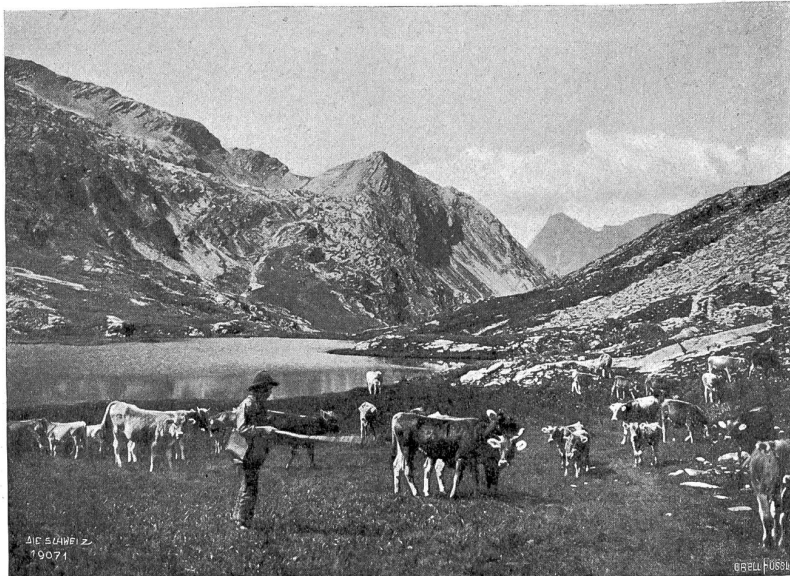
Am Palfettsee bei S. Bernardino (Misox).

der biedere Todendeutsche auf seiner Schweizerreise — eine Schweizerreise gehört zu den unumgänglichen Lebensbedingungen eines jeden Todendeutschen — über den stilwidrigen Zürcher Asphalt Augen und Ohren aufreißt. Soll er es nicht, hat er etwa nicht recht? Von Kindesbeinen an weiß er, daß man sich unter einem „Schweizer“ einen Melker, einen richtiggehenden Kuhmelker vorzustellen hat, und wenn das gesegnete Land des Emmentalers es kürzlich durchgesetzt hat, daß wenigstens amtlich die ominöse Bezeichnung in Deutschland abgeschafft wurde, so geht er halt mit einem Nachsehzucken über diese diplomatische Laune hinweg. Klappt seine gebümmelte Reisetasche — „Gute Reise“ ist darauf gestickt, wenn sie gebildet ist aber „Bon voyage“ — zu und dampft ab. Ich will daher diese Reisetasche — die gebildete, die natürlich schon weiß, daß der Kulturmelker eines Volkes die