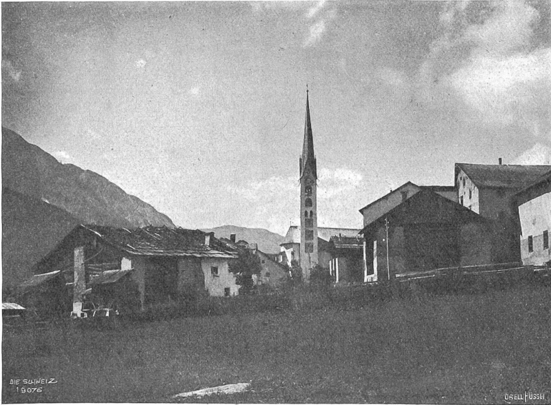
Engadiner Dorf (Zug).

verfängt. Dezentes Parfüm — Frau-frau — pikante Halbschuhe, babylonische Sprachenverwirrung. Am Schluß geht das romanische Blut mit seinen Trägern durch, hebt den taubgejubelten Sieger auf die Schultern und trägt ihn ungeachtet seiner wenig salonfähigen „Kleidung“ mitten vor die vornehme Tribüne.