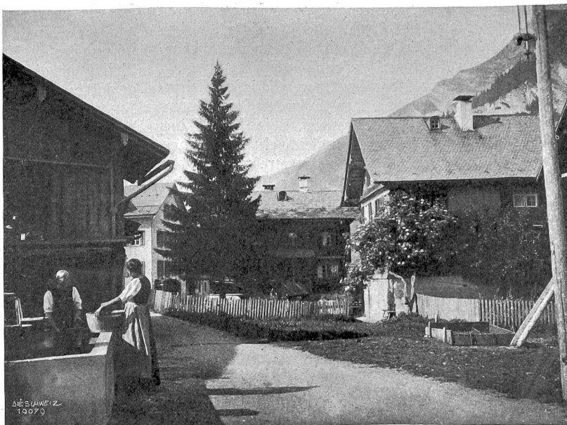
Straße in Elm (St. Gallen).

Bahnsteig zum andern, stürzt vom Bahnhof zur Schifflande oder Poststation, in all der unglück-