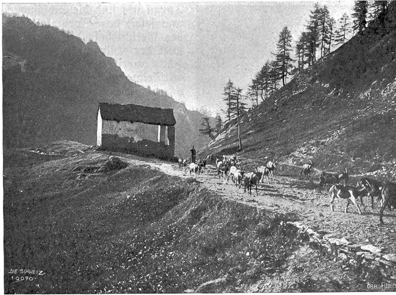
Sommermorgen in Piora.

ans Feuer, da es allmählich hier oben kalt wurde, „warum sagst du Signori, da ich doch dein einziger Zuhörer bin? Und wie kannst du immer im schönsten Waxsen der Geschichte aufhören? Hast du wohl all das auswendig gelernt? Denn du nimmst da eine Sprache in den Mund, die man in keinem Buche schöner fände ... Willst du noch eine Zigarre? Ei, wie wollte ich so gern, wir hätten uns nicht unterbrechen müssen! Bin ich doch ganz in die Sache