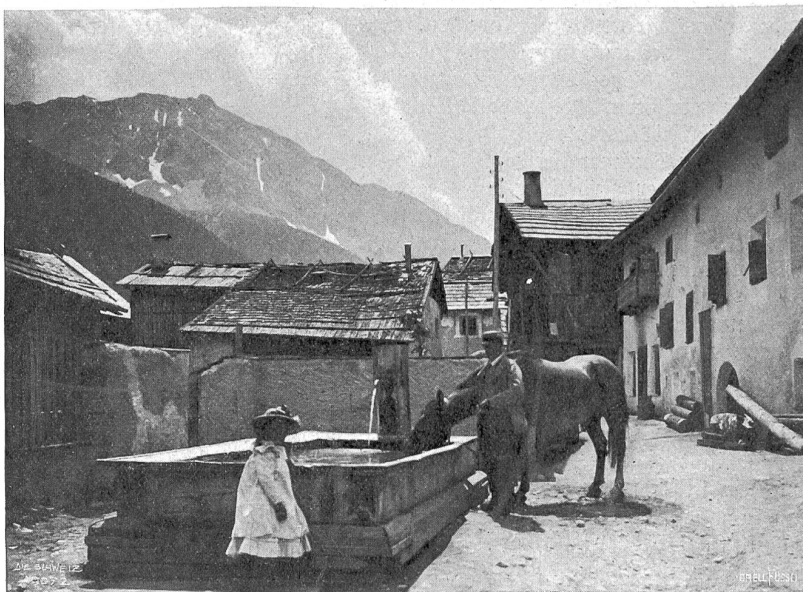
An der Tränke (3103, Oberengadin).