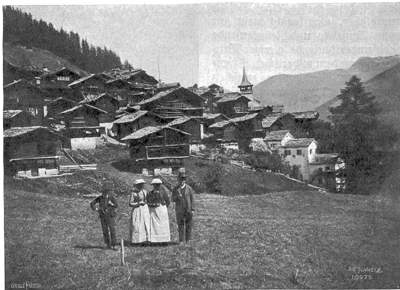
Walliser Dorf (Ormeny im Val d'Amblyers).

nicht ein pfeilschnelles Skiff über das Wellengekräusel fliegt, wo nicht die Vierer sich messen und das grobe Geschick der Achter von kommenden schweren Schlachten kündigt. Was eine Ruderregatta auf einem Schweizersee auszeichnet, ist ihre Helligkeit. Nicht zwischen rauchgeschwärzten, ruhigen Häuserzeilen, Fabriken und Lagerstuppen auf einem engen Flußbett spielen sich die Wettkämpfe ab: über eine weit in der Ferne verschimmernde blaue Wasserfläche spannt sich ein ebenso farbenjubilender Himmel, Berge, gewaltige Bergmassive mit weißen Scheiteln sind die Kulissen, flinke Motorboote schießen die Kreuz und Quere, es krängen die Segler über nach Lee. Lachendes Leben auf den Tribünen. Feldstecher und bläulicher Zigarettenrauch, der sich kokett um starre Riele oder wippende Federn ringelt, wenn er sich nicht im rotgebänderten Stroh