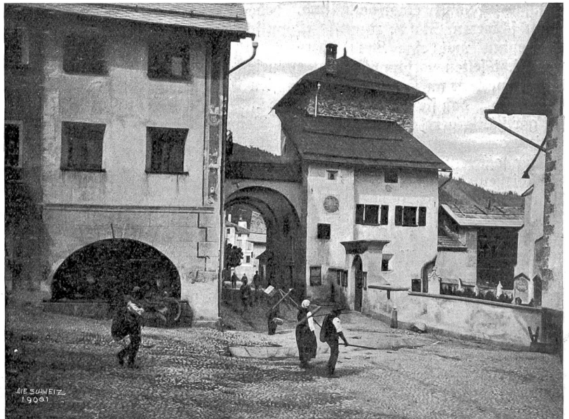
Dorfplatz in Zuz (mit Plantahaus).

Mehr Schranken hat die Erde. Die Automobilisten der Schweiz müssen das leider vielfach buchstäblich erfahren. Ein Teil der Bevölkerung steht dem Benzingeschirr feindlich gegenüber, und die Behörden sind gezwungen, darauf Rücksicht zu nehmen. Verschiedene wichtige Straßen sind für das Auto gesperrt oder beschränkt. Des einen Tod, des andern Brot: dem Wander- und Radsport kommt die Befreiung von dem „Tyrannen der Landstraße“ zugute. Die großen Wanderfahrten zu Rad erfreuen sich ebensolcher Beliebtheit wie die Straßenrennen, unter denen die Fernfahrt München-Zürich schon als „klassisch“ angesprochen wird. Stehende Rennbahnen hingegen