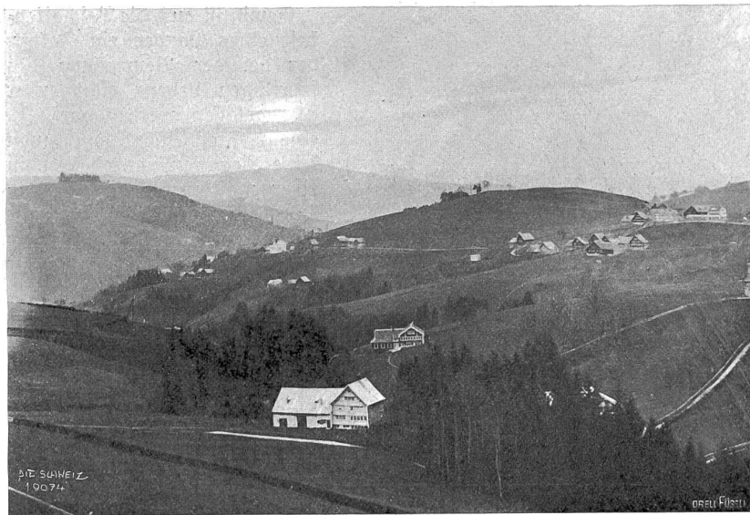
Abendstimmung über dem Appenzeller Mittelland (von Wald gegen St. Gallen gesehen).

den Bergriesen auf dem Buckel herum — Halt, da haben wir schon Sport! Wie sieht es damit aus, was bietet darin die Schweiz?