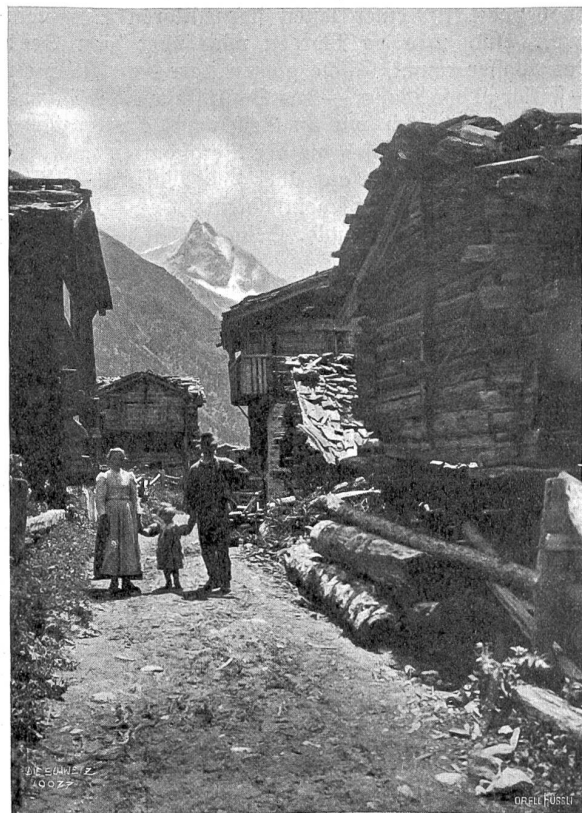
Straße in Zinal (Wallis) mit Lo Besso (Seehöhe, 3675 m).

Seeer heller Sterne, und manchmal ist es, als sei er selbst mit diesen Silbernägeln beschlagen. Noch eine Stunde, da taucht eine dunkle Masse im See auf — eine Insel — ein weltverlorenes Eiland — der Anker sauft in den Grund. Das Großsegel fällt herab und dient als Zelt. Die Schiffslaterne gibt spärlich flackernden Schein. Der Spirituskocher flammt auf — ah, wie schmeckt