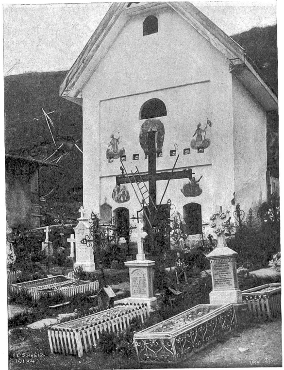
Beinhaus in Cumbels (Kungnez).

mit ihren Volksliedern die Zuhörer hoch erfreut. Einige der Mädchen hatten alte Trachten nachgeahmt und dazu die schon erwähnte „Begineklappe“ aufgesetzt, die um die Mitte des neunzehnten Jahrhunderts von allen Frauen und Kindern von früh bis spät, am Sonntag und am Werktag getragen wurde. Eine noch ältere Zeit veranschaulichten ihre Begleiter. Bis in den Anfang des neunzehnten Jahrhunderts hinein war diese Kleidung bei den Männern im Klettgau allgemein. Wenn sie zum Kirchgang oder einer andern wichtigen Angelegenheit angezogen waren, so sah der mächtige Dreimaster auf dem Kopf; vom Hemd ragte der „Vatermörder“ aus der schwarzen Halsbinde, die von einer silbernen herzförmigen Schnalle gehalten war. Schwargefärbte Leinwand bildete das „Ghäs“ (Kleider). Pluderhosen reichten bis zu den Knien; auch die Oberärmel des Rodes waren stark gebauscht, während die Vorderärmel glatt und eng sich dem Arme anlegten. Die Weste aus rotem Tuch hatte Silberknöpfe und wurde nicht wie sonst über die Hose getragen, sondern in diese hineingesteckt. Die Hosenträger lagen daher sichtbar auf der Weste; sie bestanden aus Leder oder Samt, und auf dem Verbindungssteg über der Brust war der Name des Eigentümers und die Jahrzahl aufgestickt.