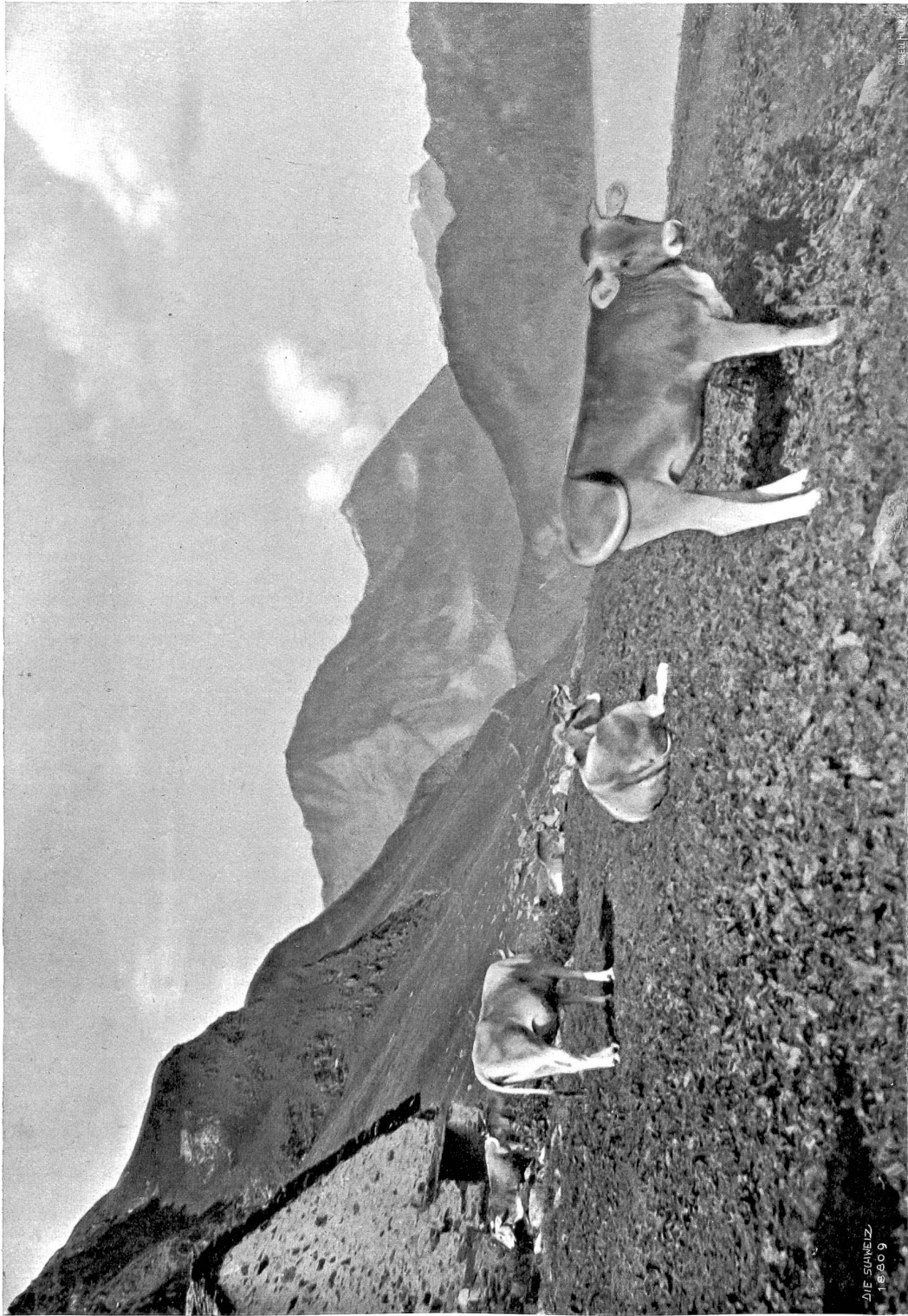
Kuhweide im Tal Piora ob dem Rifomlee.