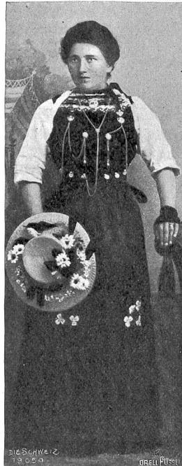
Mädchentracht um 1910 aus Schleithem, Kt. Schaffhausen.