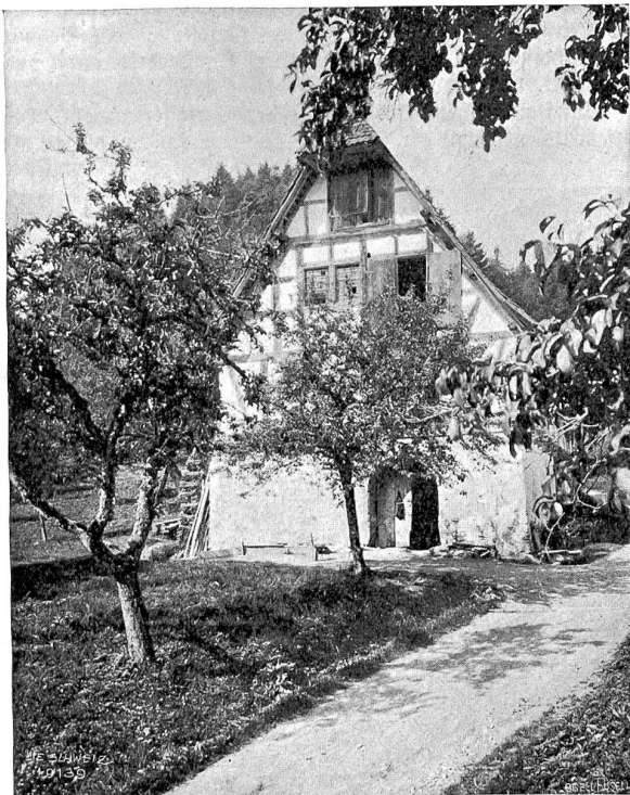
Altishofen Abb. 8. Bauernhaus beim Schloßli von 1671.