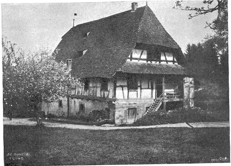
Altishofen Abb. 9. Bauernhaus beim Schloßli von 1671.

Mit einer feinen Wollust, einer mit jeder gewiegten Blütenbolde zugleich schwingenden Sensibilität fühlt Isabelle Kaiser