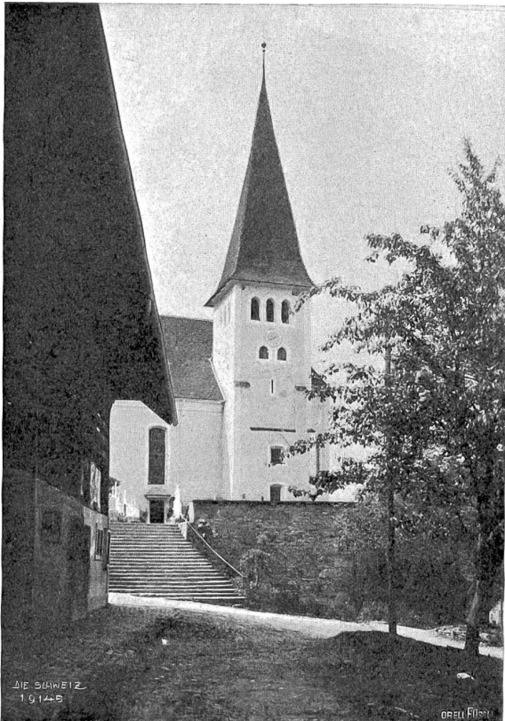
Altishofen Abb. 6. Kirchturm (romanisch).

den architektonischen Formensinn unserer Altvordern*). Wie grenzenlos schade, daß diese den heutigen Bedürfnissen nicht mehr entsprechende Art des Holzbaues allmählich so unwiderprüflich verschwindet! Da springt uns ein besonders hübsches Beispiel in die Augen an der Straße, die nach Nebikon führt, ein zierliches Speicherchen aus dem Jahr 1802 (vgl. Abb. 11), mit Klebdächern, reich geschnitzter Türrahmung und lustig blinkenden Fensterchen. Unter dem Dachvorsprung ist in weißen Lettern der sehr vernünftige Spruch zu lesen: