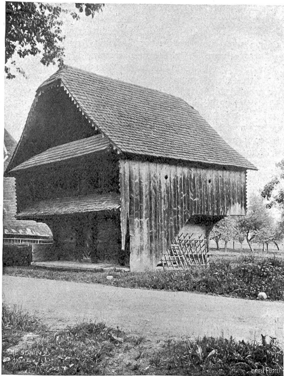
Blifshofen Abb. 11. Speicher von 1802.

Jetzt ist es, als müsse aller Trug weg, aller Schein fort. Der goldene Vorhang bläht sich schon im echten Wind, der vom See herkommt. Dann fällt er ganz — die Sonne quillt herein in den Raum, die echte, goldene Sonne; geblendet wenden sich die Augen weg, der See leuchtet weit und groß und blau, und die schweren grünen Ufer von drüben grüßen herein. Und jetzt breiten sich die Arme aus, die Stimmen erheben sich und werden mächtiger, die Fahnen wehen, alles zittert in der gleichen großen Seligkeit — die Barke der Schweizer fährt an, ganz langsam, und landet am Ufer. Siebentausend Menschen jauchzen auf.