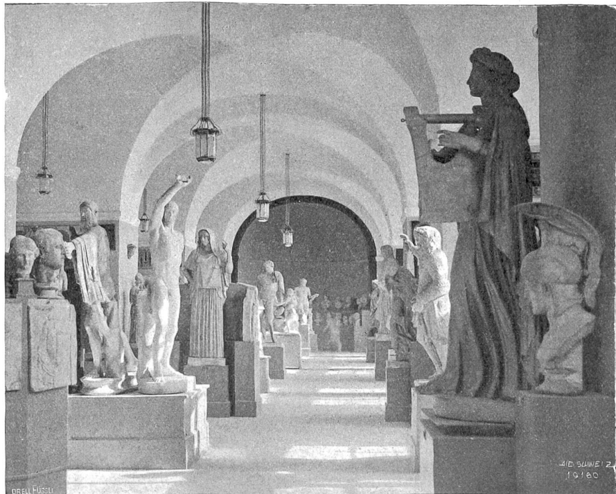
Archäologische Sammlung der Universität Zürich. Blick in den Lichtof (oben) und in die Große Halle (unten).