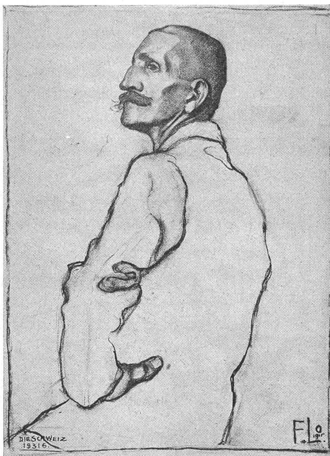
Von der Ausstellung im Zürcher Kunstgewerbemuseum Abb. 2. Zeichnung nach lebendem Modell, ausgeführt in der Klasse für Lithographie, Holzschnitt und Plakat (Lehrer Ernst Württemberg, Schüler Erik Lobed).