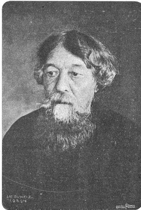
Wassilij Stepanowitsch Morosow (1850–1914).

Wir saßen und lernten. Es war so still und feierlich in der Schule — sogar gehustet wurde nur wenig. Da kam, als