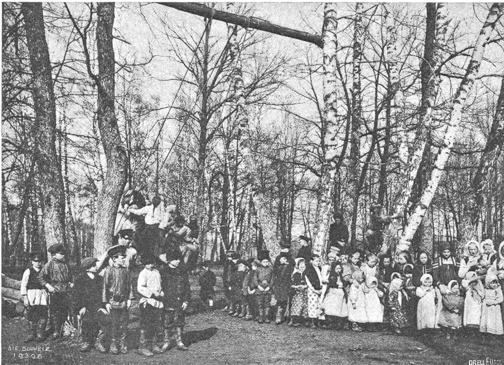
Kinder aus der Gegend von Tschuaja Poljana.

Ich aber schwieg; denn ich dachte, daß ich sowieso immer unglücklich gewesen