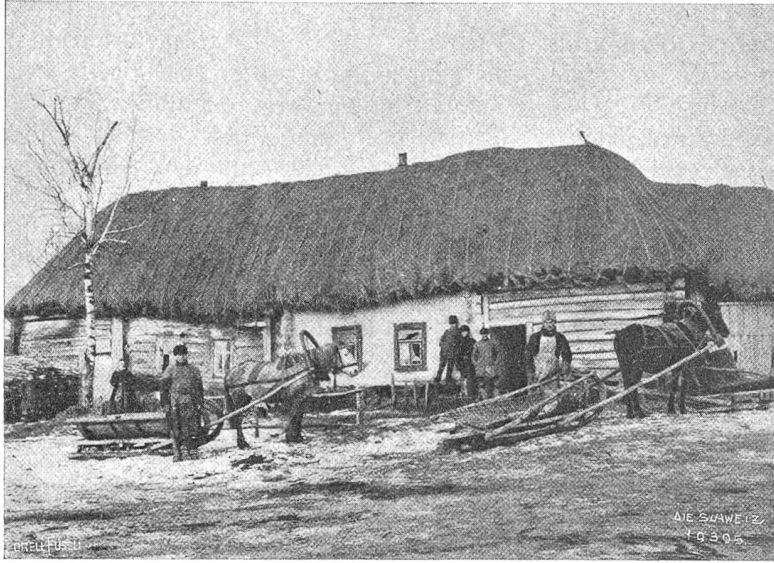
Bauernhaus in Tseljatenfi bei Jahnaja Poljana.