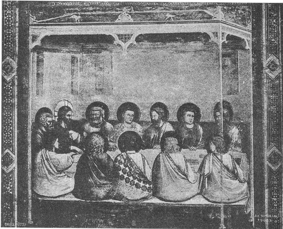
Giottos Abendmahldarstellung in der „Arenakapell“ zu Padua.