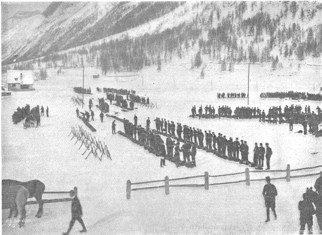
Schweiz. Grenzbefehung: Mobilisation im Engadin.