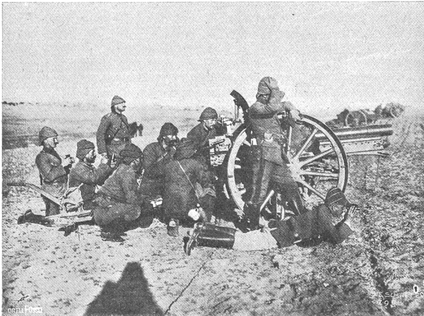
Türkische Artillerie in Feuerstellung auf der Halbinsel Gallipoli.

tun übrigbleibt als der deutschen Invasion nach Kräften zu widerstehen. Es war übrigens von vornherein bei dem englischen Charakter nicht anzunehmen, daß es mit dem durch die Zeppelinangriffe auf London beabsichtigten Terror gelingen werde, die englische Nation „auf die Knie niederzuzwingen“, wie man sich bereits auszudrücken beliebte. Die Wirkung ist bis jetzt eine durchaus gegenteilige, und was die Prophezeiungen des baldigen Friedens betrifft, so hat zurzeit immer noch das Wort Ritcheners am meisten