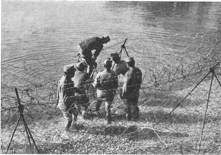
Oesterreichische Sappeure beim Erstellen von Stacheldrahthindernissen an der Adria.

banischen Küste besetzt und damit seinen Anspruch auf das östliche Adriaufer dokumentiert. Es wird nun vor die Wahl gestellt werden, diesen vorgeschobenen Posten entweder kampflos aufgeben oder aber mit Waffengewalt verteidigen zu müssen. Die erstere Eventualität käme in Anbetracht der großsprecherischen, seit Jahren im Volke genährten irredentistischen Pläne einem tief beschämenden Rückzug gleich, und die Hoffnung, die Adria zur italienischen See zu machen, dürfte für immer begraben werden.