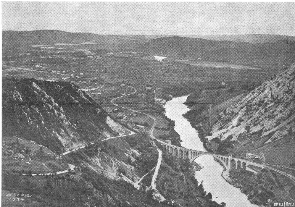
Am Ifonzo. Links Monte Santo, rechts Monte Sabotino. Im Hintergrund Görz mit Podgorahöhe.

ihrem Bestimmungsort beim Militärposten Binn eintreffen und am nächsten Tage wieder in Berisal zurück sein sollen. Als man am Freitag noch keine Spuren von der Patrouille hatte, mußte man Schlimmes befürchten, und unverzüglich machten sich ein halbes Duzend Hilfsexpeditionen, bestehend aus Militär- und Zivilpersonen, auf verschiedenen Wegen auf die Suche. Am 20. November fand man in Form gebrochener Skier Spuren der Vermißten, und man mußte sich mit der erschütternden Erkenntnis abfinden, daß der ganzen Patrouille ein Unglück zugefallen war. Der folgende Tag brachte die Bestätigung. Unter einer Lawine bei Heiligkreuz in 2½ m Tiefe fand man die Leichen