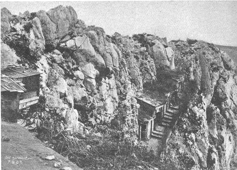
Ausgesprengte Unterstände im Karstgebiet.

vor seinem Tode das Amt eines eidgenössischen Fabrikinspektors mit großer Auszeichnung bekleidet und auch seiner Vaterstadt in verschiedenen Stellungen wertvolle Dienste geleistet.