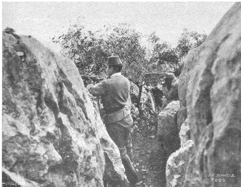
Verdeckte Linie im Karst der Isonzofront. Im Vordergrund ein bosnischer Infanterist, im Hintergrund ein verdeckter Beobachterposten.

sprengt und zu einer Kundgebung im gegenteiligen Sinne gemacht worden. — Frankreich hat den Minister Denys Cochin nach Athen geschickt, um dort im Sinne der Entente tätig zu sein. Der furchtbare Verbrauch an Menschenleben in dem stillen, aber mörderischen Schützengrabenkrieg nötigt die Regierung, jetzt schon auf den Jahrgang 1917 zu greifen,