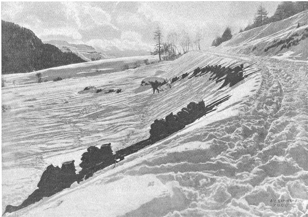
Schweiz. Grenzbesetzung: Infanterie-Schützenlinie während einem Gefecht.

Den Italienern ist es nach mehr als halbjähriger Kriegführung noch nicht gelungen, auch nur einen wirklich imponierenden und überzeugenden Erfolg zu erringen. Zu gern hätte man der Kammer bei ihrer Wiedereröffnung im Dezember wenigstens eine befestigte österreichische Stadt als Siegesbeute präsentiert; es sollte nicht sein, trotz den ungeheuersten Anstrengungen der italienischen Armee,