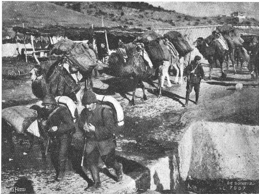
Transporte für die türkischen Truppen auf dem Wege nach Gallipoli.

und nicht nachgeben, will sie nicht vollständig kapitulieren, und es hat das paradox klingende Wort viel für sich: „Je länger der Krieg dauert, umso länger dauert er!“ Es fehlt auf der Seite der Alliierten immer noch an einem richtigen Zusammenspiel der Kräfte. Nun sind, um diesem Uebelstand abzuhelpfen, unlängst nicht weniger als vier englische Minister zu einer Besprechung in Paris gewesen, und Lord Kitchener hat den Kriegsschauplatz auf dem Balkan, Athen, Rom und Paris besucht; mit welchem Erfolg, ist vorläufig schwer zu sagen. Dabei ist noch jetzt die öffentliche Kritik in keinem Land so frei und ungehindert wie in England (auch die Schweiz macht da keine Ausnahme), wo die Maßnahmen der Regierung auf das schärfste getadelt werden und ihrer Absicht der Einführung der allgemeinen Wehrpflicht der offene Widerstand entgegen gesetzt werden darf. Allerdings ist dieser Tage eine Versammlung, wo gegen die allgemeine Wehrpflicht protestiert werden sollte, von Studenten und Soldaten ge-