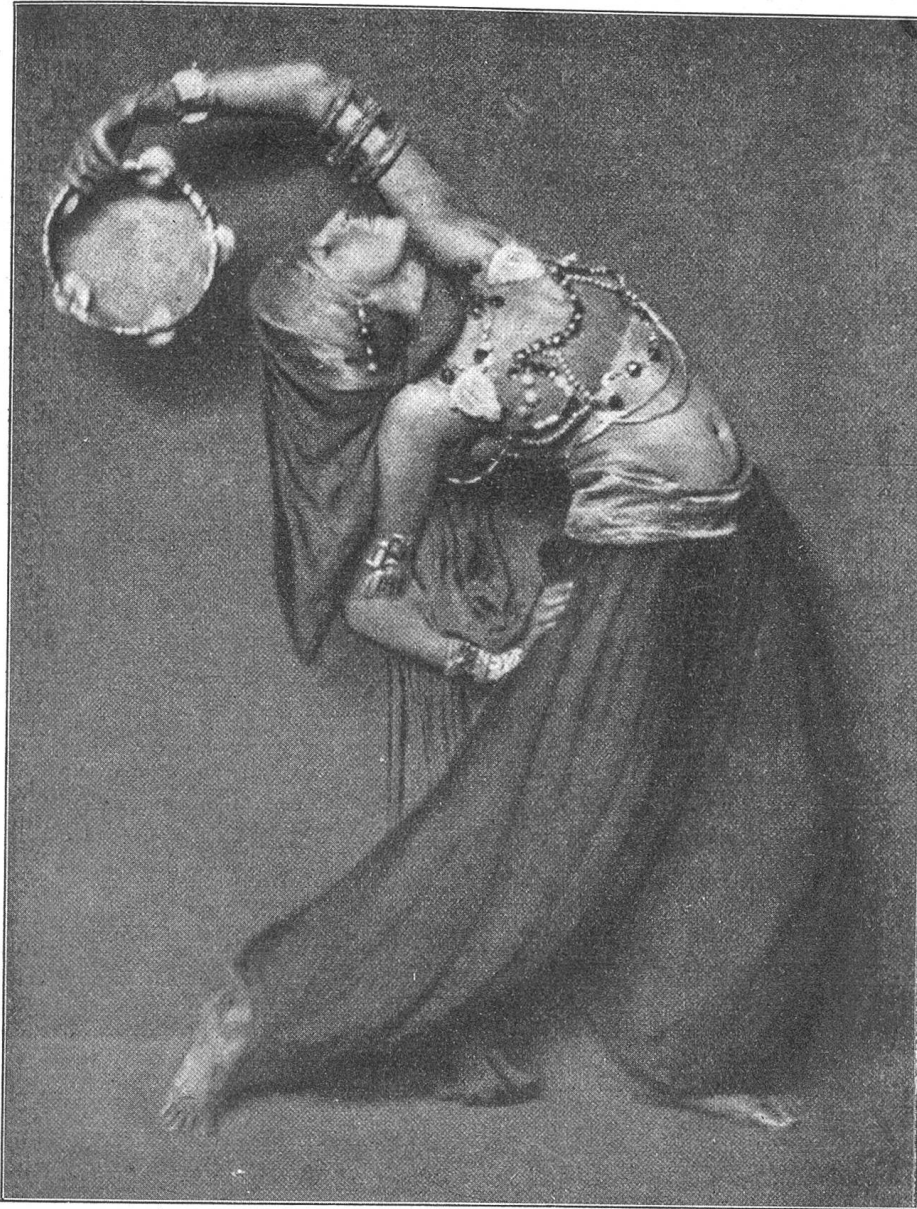
Körperbildung. Sant Mahesa in ihren orientalischen Tänzen.

übungen in mehr gerundete Formen, in anmutige, rhythmische Bewegungen. Die Gelenke werden geschmeidig, elastisch und gewinnen außerordentlich an Beweglichkeit, aber auch an Sicherheit. Die Bewegungen bekommen etwas Spielendes und werden dadurch reizvoll und anziehend. Der Körper lernt den richtigen Gebrauch der Glieder, die sich nunmehr dem Willen unterordnen. Der Körper, aber auch der Geist wird frei und leicht.