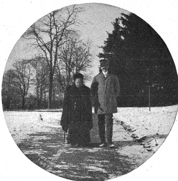
Marie v. Ebner-Eschenbach auf einem Spaziergang (1910).

tisch aufgehängt hatte. Jene unendliche Güte und Weisheit, jene vollendete Größe und — wenn möglich — vollendetere Bescheidenheit, die die Züge Marias von Ebner-Eschenbach wie eine unvergängliche Innensonne erleuchten und erwärmen, lächelten im venezianischen Palaste dem Gesang der Jubelglocken gütig zu... Heute umfängt mich nicht der mystische Zau-