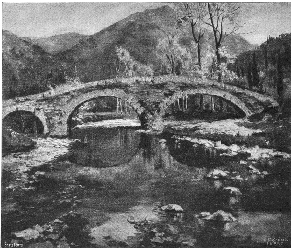
Jeannette Gauchat (1871—1915).